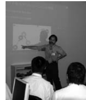
シミュレーションの世界を講師が解説

七月二十六日には、高度数値シミュレーション計算機室のコンピュータを使い、分子の運動を見たり、乱数で円周率を求めたりする「シミュレーション(模擬実験)」の講座が行われました。このうち、分子の運動を見る講座では