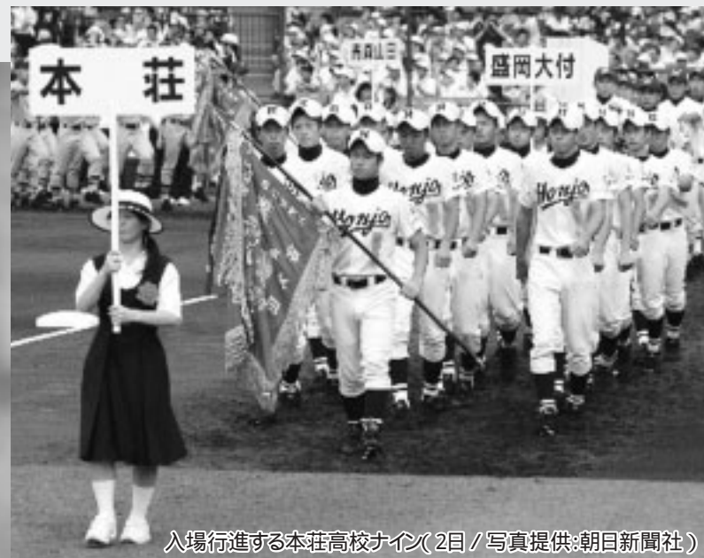
入場行進する本庄高校ナイン(2日)