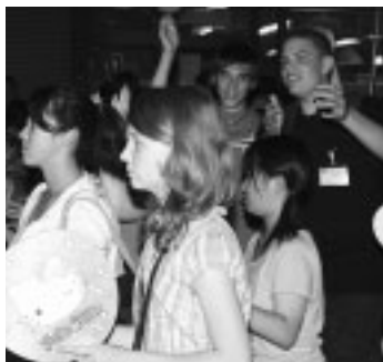
菖蒲カーニバル(8月1日)