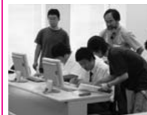
プログラム作成を県大生がサポート

その後、生徒たちは県大生の指導を受けながら手本を参考にプログラムを組み、実際には目で見ることが困難な固体・液体・気体の分子の動きをコンピュータの画面で確かめることができました。受講した生徒からは、「なぜ固体が動かずに止まっているのか、その疑問が解けた」「高校ではできないようなことを経験できた」などの感想が寄せられました。八月二日にも、多目的音響実験室や自然エネルギー活用実験住宅を使って、音や熱を測る実験が行われ、ふだんは見学しかできない設備で大学の研究を体験しました。