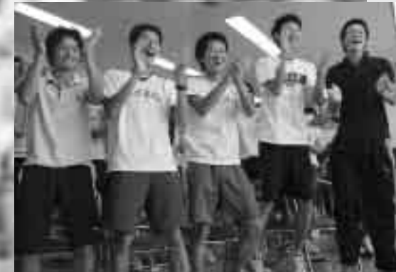
立ち上がって喜びを爆発させる留守部隊