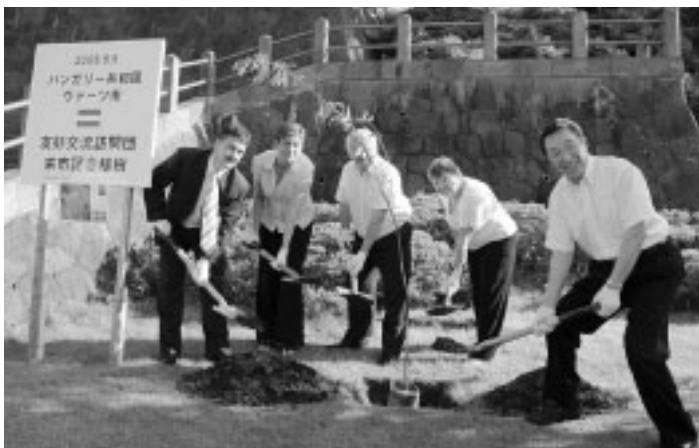
本荘公園にベニヤマザクラを植樹(8月5日)