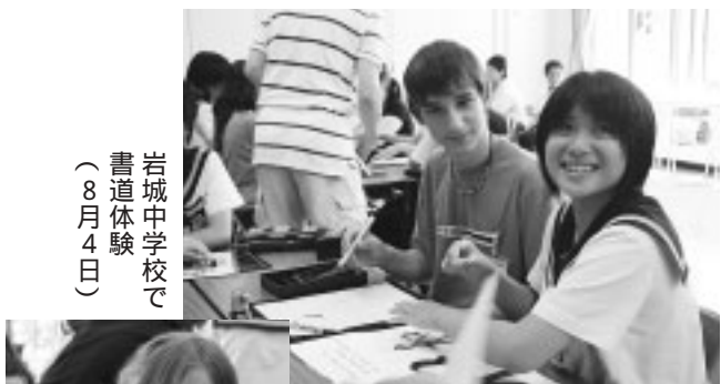
岩城中学校で書道体験(8月4日)

また、八月五日には来市記念植樹が行われ、ベニヤマザクラの木を本荘公園へ植樹し、友好の絆を強く結びました。