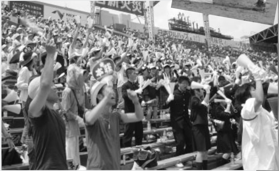
沸き上がる1塁側アルプススタンド