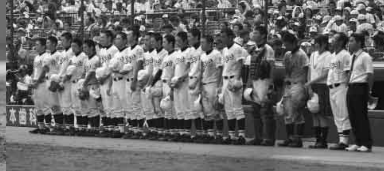
鳴門工業高校の校歌を聴く本荘高校の選手たち

少し不安もありましたが、みんなで心をついに、伝統に恥じない応援ができたと思います。スタンドではOBの方々にも盛り上げていただき、いい雰囲気でした。みんなを甲子園に連れて行ってくれた選手たちへ誠心誠意、お礼の応援ができてよかった。