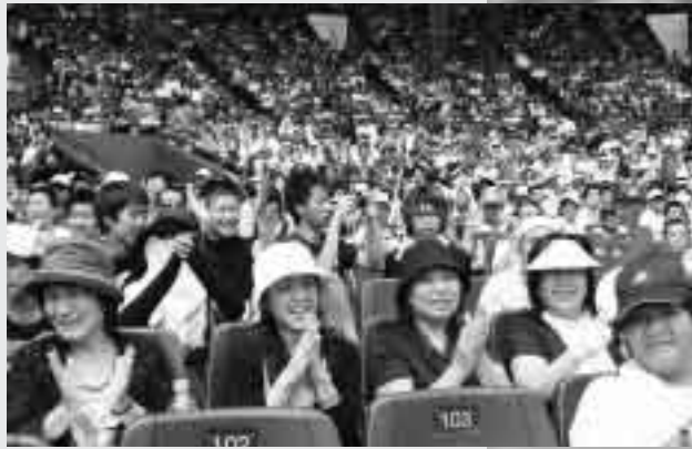
満場の観衆から惜しめない拍手が――