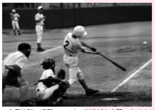
(全県決勝) 反撃ののろし 三浦が右中間へタイムリー

二十一年度から県立矢島高校と中高連携校として新たなスタートを切る矢島中は、全県大会への出場を機に、矢島高校と同じような、白に赤を基調とするユニフォームに新調。七月二十九日に行われた決勝戦では、昨年度の東北大会の覇者・羽城中を相手に雨