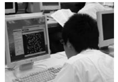
画面で見ることができた分子の動き