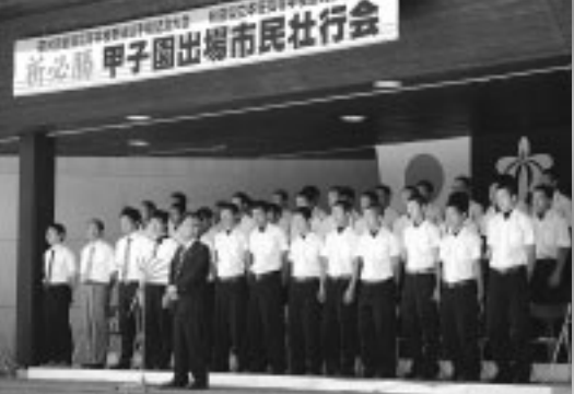
本庄公園正面広場で開かれた「市民壮行会」(7月27日)

第九十回全国高校野球選手権記念大会三日目の八月四日。会場の阪神甲子園球場は朝から強い日差しが照りつけ、場内のさわめきをかき消すようなけたたましい蝉時雨に包まれていた。気温が35度に達したこの日、第二試合の本県代表・本庄高校対徳島県代表・鳴門工業高校の試合は、十一時二十四分に開始を告げるサイレンが鳴った。