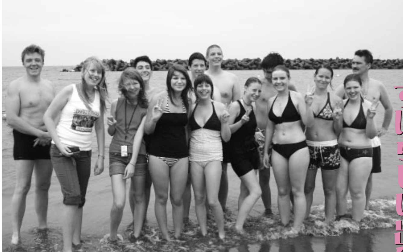
本荘マリーナで(8月2日)

本市と友好交流協定を結ぶハンガリー共和国のバーツ市友好交流訪問団ら二十一人が本市を訪問。七月三十一日から八月六日まで中学生は、市内の各家庭にホームステイをしながら交流を深めました。バーツ市からの訪問は今回で六回目。本市での滞在の様子や生徒たちが日本に来て感じた国際交流について紹介します。