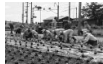
南内越花いっぱいボランティアグループ