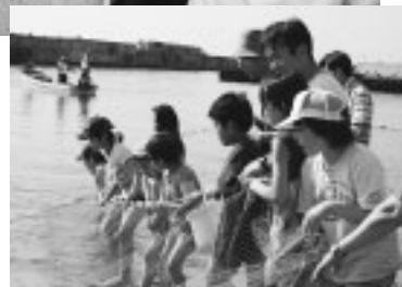
「よいしょ、よいしょ」と地引き網体験

夏を思わせる陽気の中、第三回西目漁港まつりが開催され、会場となった漁港は訪れた約三千人の人でにぎわいました。はまなす太鼓の演奏で幕を開けた「西目漁港まつり」。この日最初のイベント、稚魚放流体験では事前に申し込んだ五十組の親子が「大きくなつてね」と、ヒラメの稚魚を放流しました。続いてのイベント、漁船遊覧体験では普段なかなか乗ることのない漁船で約二十分間の船の旅を楽しみました。このあとも西目漁港や海の生物などを問題にした「お魚 x クイズ」、水槽に入った真鯛やカワハギなど七種類の魚の中から自分の好きな魚を泳がせて競わせる「お魚レース(Fish 1)」や魚つかみ取り、地引き網体験など、海に親しめるイベントが盛りだくさんでした。このほか、西目漁港で水揚げされた魚や海の幸などが並んだ出店など、訪れた人は思い思いに、海と親しみました。