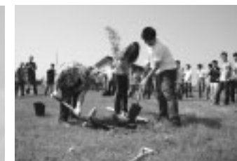
飛鳥大通公園での記念植樹