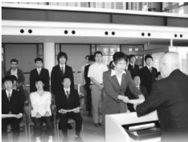
(財)本荘由利産業科学技術振興財団

(財)本荘由利産業科学技術振興財団（理事長・柳田市長）による「平成二十年助成決定通知書交付式」が六月十七日、本荘由利産学共同研究センターで行われました。これは県立大学システム科学技術学部の教員および学生を対象としたもので、本荘由利地域の産業振興や活性化につながる調査研究、学生のユニークな発想による自主研究、海外の大学や研究機関での国際交流などへ助成金を交付するものです。