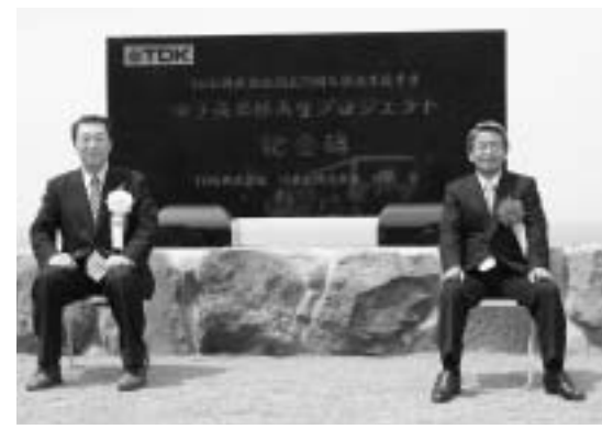
柳田市長と記念撮影に就く澤部代表取締役会長(右) (昨年5月、西目地域で)

な地域づくりのさらなる推進を誓いながら苗木を植え、県民総参加による森づくりを全国にアピールしました。表彰された学校・団体は次のとおりです。