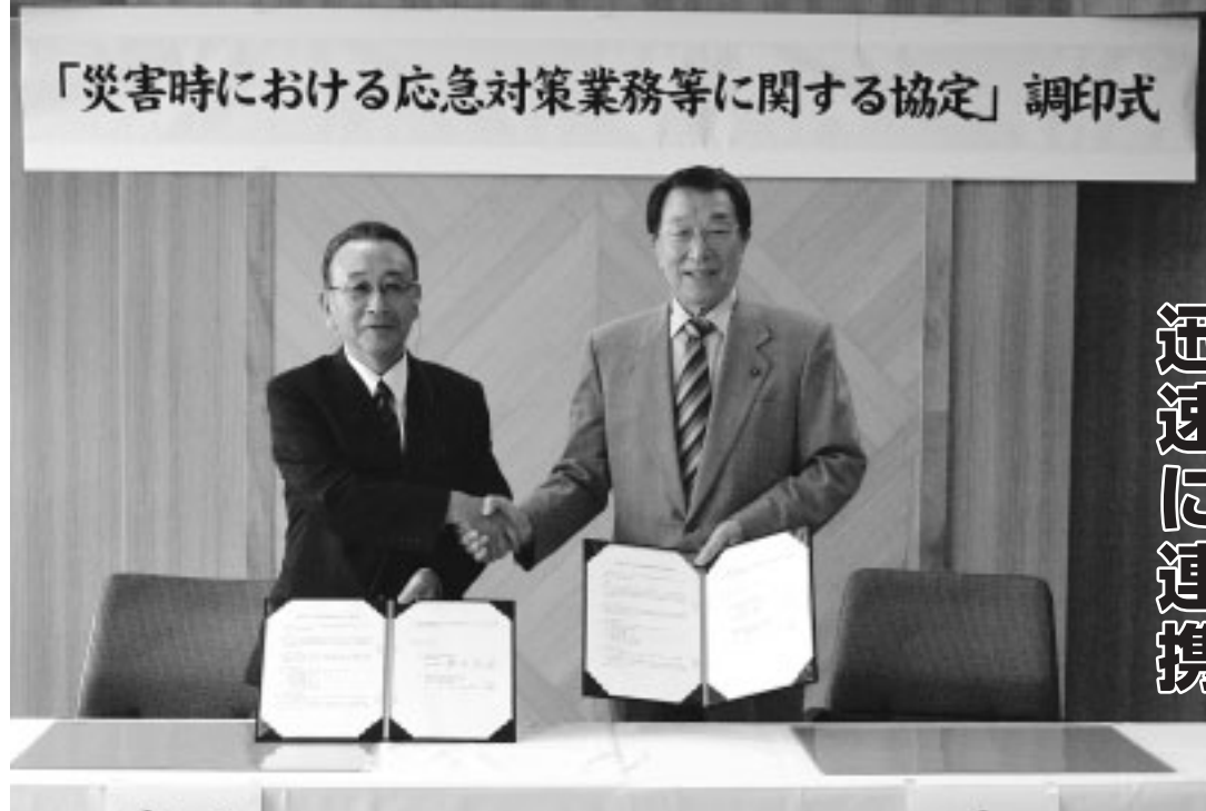
「災害時における応急対策業務等に関する協定」調印式