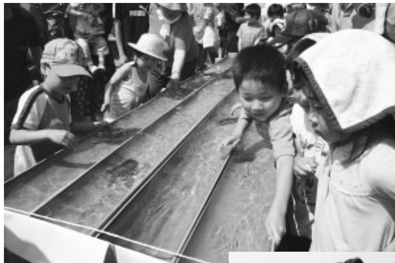
一番速いお魚は何?(お魚レース Fish-1)

今日はおばあちゃんと一緒に西目漁港まつりに来ました。(漁船遊覧体験)初めて船に乗りました。始めはちょっとこわかったけど、とても楽しかったです。また、乗ってみたいなー。