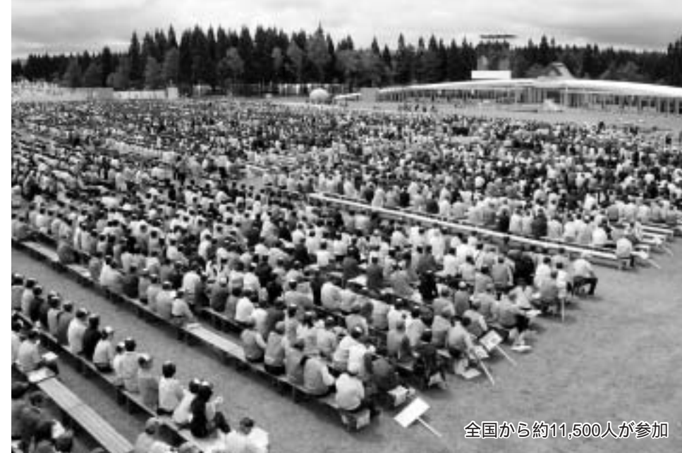
全国から約11,500人が参加