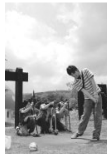
花立牧場公園でのパークゴルフ

県立大学本荘キャンパスの学生に本市の豊かな観光資源を知ってもらい、第二のふるさととして愛着を持ってもらうと六月二十一日、絆の里づくり事業「県立大生観光名所探訪」が観光協会の主催で開催されました。卒業後もこの地を懐かしみ再び訪れてもらえるように出発前には、県立大学前の飛鳥大通公園に、市の木「ケヤキ」を記念植樹しました。この日のコースとなった矢島地域の天寿酒造や花立牧場公園、鳥海地域の法体の滝など、市内の名所を巡った四十五人の学生たちは、満喫した初夏の一日を心に刻みました。