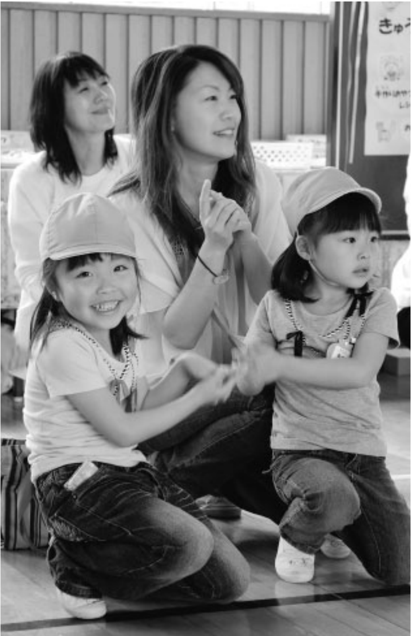
子どもたちの笑顔が輝き、歓声が響くまちに (6月14日(土)、わんぱく広場で)