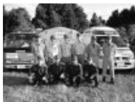
地震被災地へ緊急派遣された市消防本部の援助隊

災害はいつ、どこで起きるかわかりません。普段から注意し、万一の時に備えましょう。