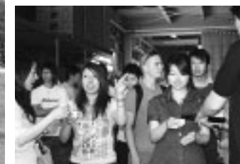
天寿酒造を見学して試飲