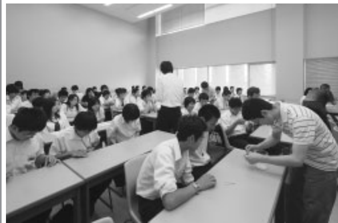
昨年のオープンキャンパスでは、模擬講義に大勢の高校生が参加しました。

◇高校生、一般向け 県立大学がわかる定番の見学会 オープンキャンパス とき 7月19日(土)午前10時45分～午後4時 ところ 本荘キャンパス 内容 「施設見学ツアー」「模擬講義」「研究展示」「学科説明会」「入試説明会」「進学相談」