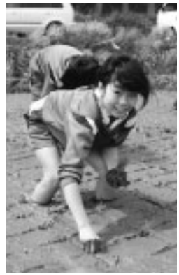
「田植うて楽しい」 笹子小の体験学習で

入場券は6月30日ごろに「自宅へ郵送されます」 入場券には選挙区名、投票所名、投票時間が印刷されていますので、お間違えのないようご確認ください。 当日都合のつかない方は、期日前投票ができます。投票日に旅行や仕事など、やむを得ない事情により投票所に行けない方は、期日前投票を行うことができます。 期日前投票所の設置期間 6月30日(月) ~ 7月5日(土) 期日前投票をされる方は、入場券の裏面に印刷されている「期日前投票宣誓書」に記入し、期日前投票所へご持参ください。