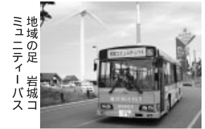
地域の足 岩城コミュニティバス

問い合わせ 国土交通省子吉川出張所 ☎22 - 6360 FAX 22 - 4166