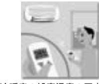
冷暖房の設定温度の工夫などできることから始めてみましょう

減少のため、3Rと同様に「家庭で実践できる取り組み」身近にあります。 地球にやさしいライフスタイルを心がけ、地球温暖化を防ぎましょう。