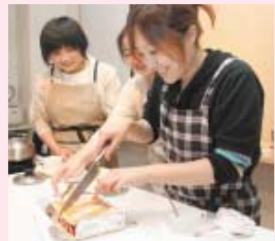
露地物イチゴを使ったケーキづくり教室で（6月6日）

時に添い歴史つらぬき 里をうろおし人をむすんで 子吉川 海へと向かう水の道 その海はせめぎあう世界へひらく 先人の知恵に学んで今日を生きる ふるさとの四季おりおりに 花はほほえみ風は薫って 鳥海の 山きよらかに裾をひき 頂はめくるめく宇宙につづく 子どもらとともに夢見て明日を創る