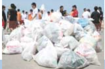
三年生が集めただけでもこの「山」に――