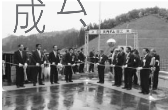
完成祝い、喜びのテープカット

大内ダムは一級河川子吉川水系芋川と畑川流域の洪水防止、水道水や農業用水の確保などを目的とした重力式コンクリートダムで、昭和六十三年に予備調査を実施。平成十六年に基礎掘削を始め、十七年五月から一年半にわたり堤体コンクリートの打設が行われました。堤高二十七・五メートル、堤頂長百六十六メートル、総貯水量は七十二万四千立方メートルで、総事業費は五