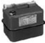
ガソリン携行缶(例)

◆灯油用ポリ容器にガソリンを入れることは、とても危険です。絶対にやめてください。ガソリンなどを入れる容器は、必ず消防法令に適合したもの（携行缶など）を使用してください。