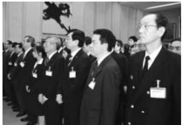
年度初めの訓示に 聞き入る職員

円ですが、これも対前年比16・5%の減です。そうした財政の中で、市民の皆さんに本当に喜んでいただけるようなものにするには、知恵を出さなければならぬと考えます。無駄を省きながら、必要なものを優先して進めていくことになると思ひます。