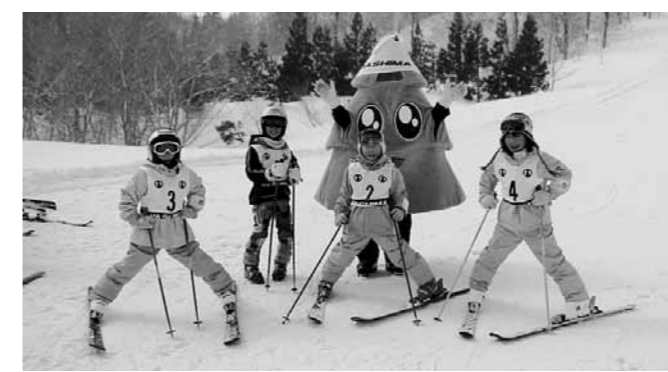
スギッチと一緒に「ハイ・ポーズ!」

白銀のグレンデがまぶしく輝いた三月二日、鳥海高原矢島スキー場で矢島スキー大会が開催されました。 大会には保育園児から壮年まで、十四のクラスに約百人が出場。県マスケット(団体マスケット)のスギッチも大会コースを滑走するなど、選手たちに声援を送っていました。 成年以上のクラスでは、ゴールタイムを申告して、そのタイム差を競う、特別賞も設けられ、一番近い選手は〇・六秒の差でゴールするなど、タイムの早さだけにとらわれず、大会を楽しみました。