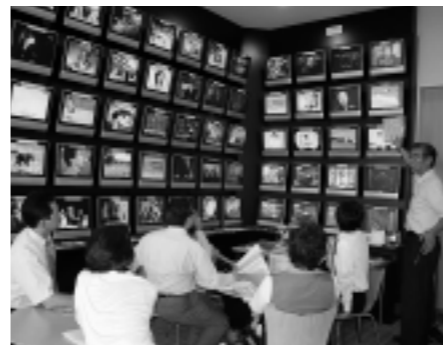
市CATVセンターを視察

また、市ソフトボール場への進入路は、国管轄の荒町防災ステーション建設工事の作業用道路であり、大会期間に限り使用許可を受けている現状です。この工事完了後に占用などの手続きを行い、正式な進入路としての常設の案内看板を設置する計画ですので、ご理解くださるようお願いいたします。