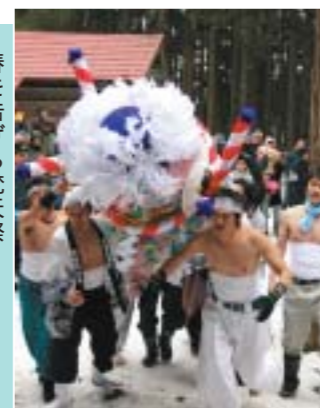
春を告げる梵天祭 (3月9日、大内地域で)

由利本荘市歌 時に添い歴史つらぬき 里をつるおし人をむすんで 子吉川 海へと向かう水の道 その海はせめぎあう世界へひらく 先人の知恵に学んで今日を生きる ふるさとの四季おりおりに 花はほほえみ風は薫って 鳥海の 山きよらかに櫻をひき 頂はめぐるめく宇宙につづく 子どもらとともに夢見て明日を創る