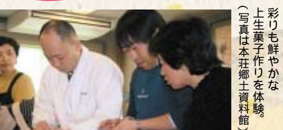
彩りも鮮やかな上生菓子作りを体験。(写真は本荘郷土資料館)