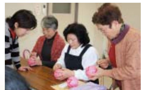
ひと刺し、ひと刺し心を込めて、雅びなごんまりがひな飾りをより一層華やかに見せます。(ごんまりつるし飾り作り講習会)

市内各地域に古くから受け継がれてきたおひなさまを展示し、好評のうちに開催されている「由利本荘ひな街道」に、関連イベントとして行われたごんまりのつるし飾り作り講習会や、ひな菓子作り体験も人気で、参加者は、ひと味違ったひな祭りを楽しんでいます。皆さんもぜひこの機会にひな街道を巡り、ゆりほんじょうの歴史情緒に浸ってみませんか。