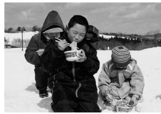
ゆっくり食べたけれど、急がなきゃ!

青空が広がり、春を思わせる天候の下、「早春やしお元気まつり」が三月二日、八塩いこいの森で行われました。 今年も、雪上パークゴルフ大会やスノーモービル同乗体験、雪中宝探しゲームなど雪の中で楽しむイベントが盛りだくさん。お昼どきに行われたカップ麺の早食い大会では、アツアツのカップ麺に悪戦苦闘しながらも、「一番は私」と夢中になって頑張っていました。参加した人たちの元気な声が、雪の広がる八塩いこいの森に響きました。