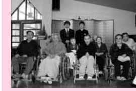
施設の皆さんと、笑顔で (本荘北中)

子どもたちの心温まる優しさは、きっとお年寄りたちの心の中にも春を運んで来てくれたことでしょう。