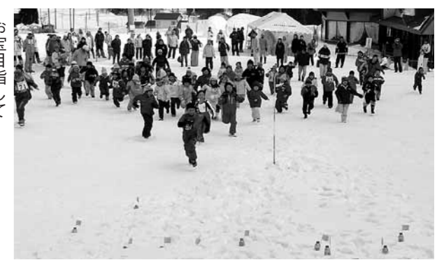
お宝目指してダッシュ！ダッシュ!

天候に恵まれ暖かな陽気に包まれた三月二日、オコジヨランドまつりが行われました。 雪中宝探しなどさまざまな雪上ゲームを楽しむもと会場となったオコジヨランドスキー場に訪れた人は約二百人。スノーモービルや雪上車の体験乗車が人気で、雪上の疾走に大きな歓声が響きました。 「親子DEバイアスロン」「スノーシュー」「スノーシュー」など親子で参加する催しでは、休日の家族のふれあいに子どもたちのうれしそうな表情がはみまみしました。