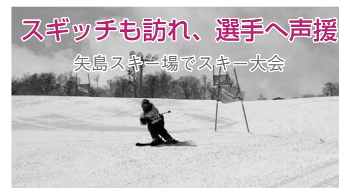
スギッチも訪れ、選手へ声援 矢島スキー場でスキー大会

白銀のグレンデがまぶしく輝いた三月二日、鳥海高原矢島スキー場で矢島スキー大会が開催されました。 大会には保育園児から壮年まで、十四のクラスに約百人が出場。県マスケット(団体マスケット)のスギッチも大会コースを滑走するなど、選手たちに声援を送っていました。 成年以上のクラスでは、ゴールタイムを申告して、そのタイム差を競う、特別賞も設けられ、一番近い選手は〇・六秒の差でゴールするなど、タイムの早さだけにとらわれず、大会を楽しみました。