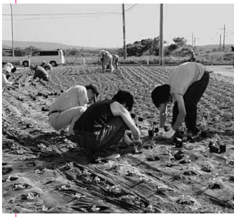
南内越地域の花壇づくりで

これらの機会を与えてくださった、大学と地域の皆様に深く感謝申し上げます。大学で学んだことを社会に