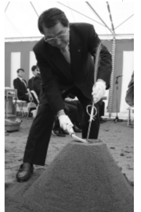
安全を願い鍬入れ

区画整理事業の進捗に伴い、移転補償事業として美倉町で建設が進められている市第二庁舎の安全祈願祭・起工式が二月二十九日、市、議会、工事業者や町内会などの関係者約六十人が出席して行われました。