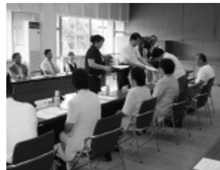
委嘱状交付式で（昨年8月10日）