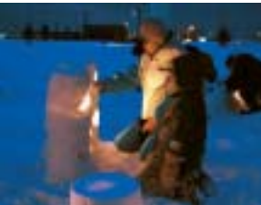
ミニかまくら作りがんばるゾ！