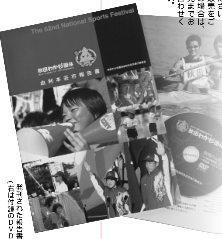
発行された報告書 (右は付録のDVD)