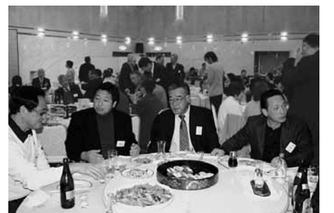
思い出話に花が咲いた会場

員の紹介や、若年層の参加を促進するため首都圏に在住する成人者を招待するなど、世代を越えて交流を深めました。 懇談会では、会員による三味線の演奏や、ふるさと産品などが当たる抽選会、カラオケなどの余興で大盛り上がり。ふるさとなまりや思い出話に花が咲く楽しいひとときを過ごしました。