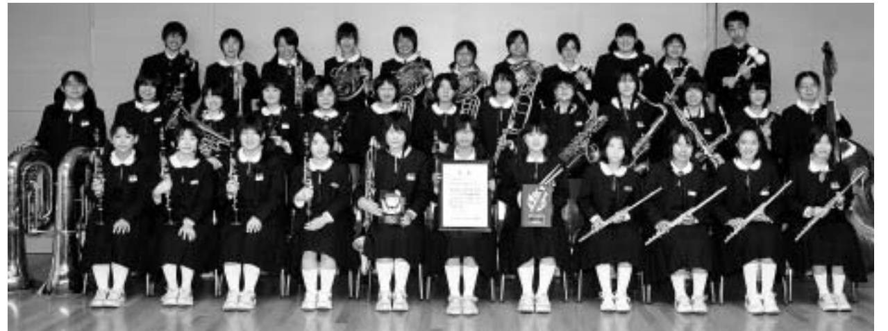
本荘南中学校(中学校の部)

身近な明るい話題を広報広聴課までお寄せください。 皆さんからの情報をお待ちしています！