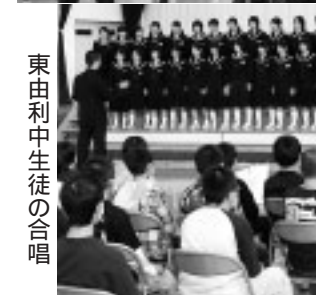
東由利中生徒の合唱