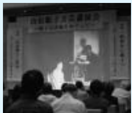
映画「現代日本文学巡礼」を上演

本荘が生んだ文人・山田順子(旧本荘町古書出身)の生涯と作品の評価をめぐる文芸講演会が十月十七日、本荘公民館で開かれました。山田順子の生涯とその作品世界を、本荘公民館との合同企画展「作家・山田順子の生涯とその作品世界」を開催中で、ぜひ一度足を運んでください。 本荘郷土資料館では現在、本荘公民館との合同企画展「作家・山田順子の生涯とその作品世界」を開催中で、ぜひ一度足を運んでください。 山田順子(旧本荘町古書出身)の生涯と作品の評価をめぐる文芸講演会が十月十七日、本荘公民館で開かれました。山田順子の生涯とその作品世界を、本荘公民館との合同企画展「作家・山田順子の生涯とその作品世界」を開催中で、ぜひ一度足を運んでください。