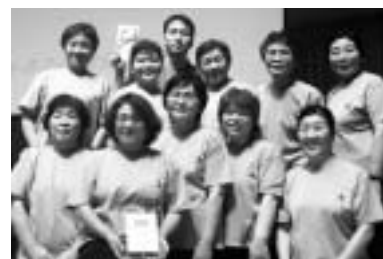
市食生活改善推進協議会岩城支部 有志の皆さん

フィットネスダンス2009全国大会が九月三十日、東京都渋谷区で開催され、市食生活改善推進協議会岩城支部の有志が三年連続となる優秀賞に輝きました。