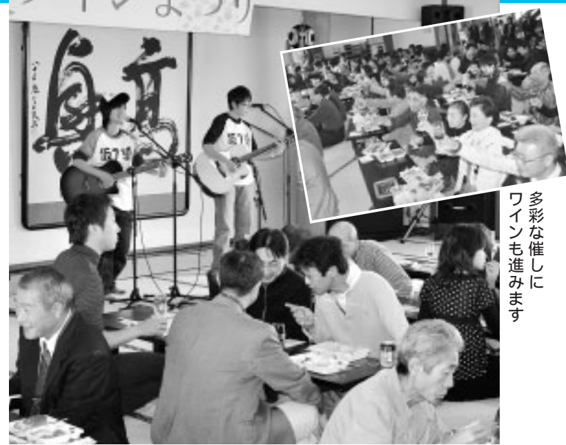
多彩な催しにワインも進みます