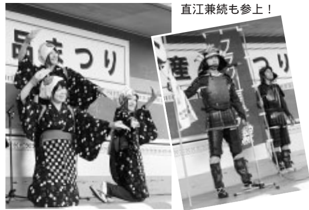
由利高校民謡部のステージ発表