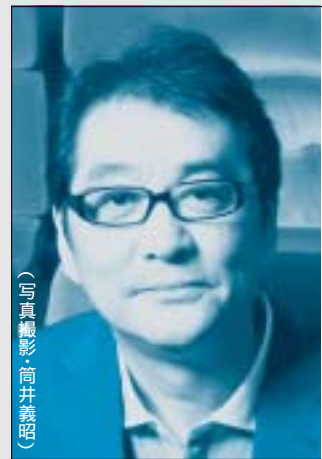
講師 アカデミー賞受賞映画監督 滝田 洋一郎さん

来月三日(火)、善隣館で文化講演会が開催されます。講師は映画「おくりびと」でアカデミー賞外国語映画賞を受賞された日本映画の巨匠・滝田洋一郎さんです。「陰陽師」の大ヒットや「壬生義士伝」で日本アカデミー賞最優秀作品賞と優秀監督賞を獲得された滝田監督。講演は「由利本荘市民と語る」と題し、由利地域の方々や法体の滝での「釣りキチ三平」の長期口ケを支援した女性の皆さんとのトーク型で行われます。秋深まる文化の日、お誘い合わせのうえ、「ご聴講ください。」