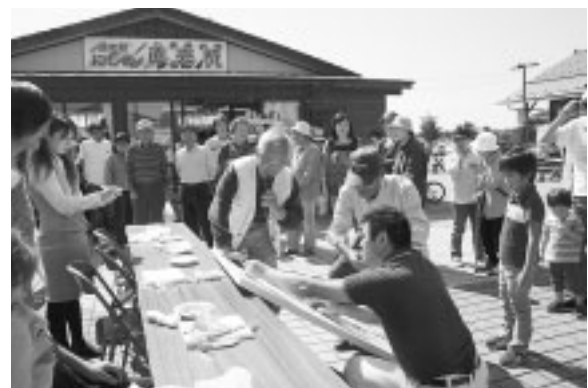
むいた皮の長さを測っています