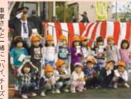
車掌さんと一緒に「ハイ、チーズ」