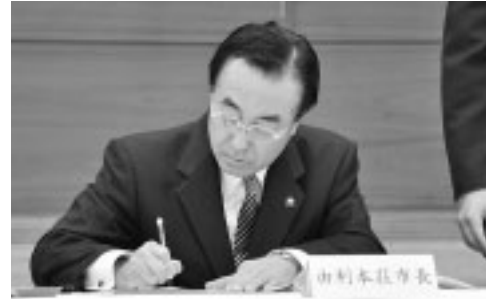
協定書に署名する長谷部市長