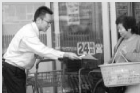
各店舗で、内容を周知するチラシを一斉配布(10月4日、マックスバリュ本荘店で)

活動(環境保護活動)を実践していただければいいでしょうか。一人一人の小さな心がけが、やがて大きな力となっていくはずですよ。