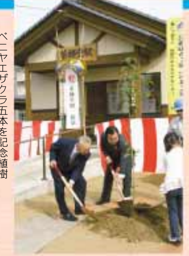
ベニヤエザクラ五本を記念植樹

No. 110 平成21年 2009年 10月15日 編集・発行 由利本荘市広報広聴課 http://www.city.yurihonjo.akita.jp