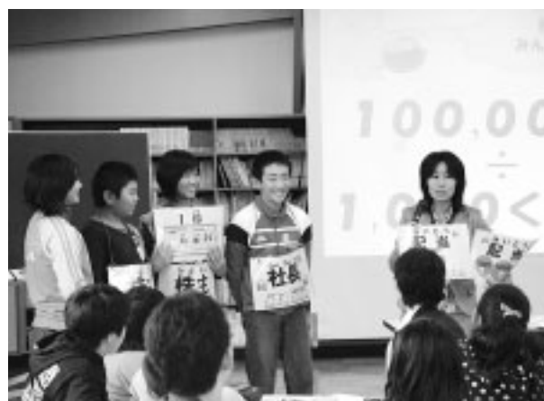
児童が社長や株主になって、株式会社のしくみを体験

経済とは、株式会社のしくみ。私たちが暮らしのかかわりについて理解を深め、世の中の動きに興味や関心を持ってもらおうと、(株)東京証券取引所の出張授業「私たちのくらしと株式会社」が矢島小学校で十月六日、同校の六年生を対象に行われました。 児童は、東証の若手社員などが一人ずつ加わった八つのグループに分かれ、経済や株式についてのしくみなどのほか、「国・会社・家それぞれの役割、身近な商品やサービスで工夫している点」など、身近なテーマを中心に学習。最後は将来の夢について、その実現に向けて今できることは何かを一人一人考えました。