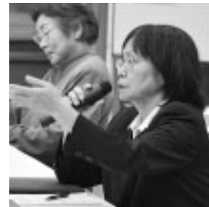
協定締結後は、意見交換が行われました