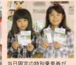
当日限定の特別乗車券が発行されました