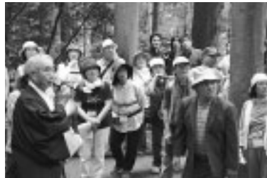
森子大物忌神社で宮司の話に耳を傾けました

鳥海山ろく線「おぼこ号」を利用して、沿線を探訪し、地域の魅力を発見してもらおうと九月二十六日、今回で九回目となる「おぼこハイク」が行われました。 黒沢駅をスタートした参加者五十七人は、絶好のウォーキング日和の中、徒歩で約九キロを移動。途中、おぼこ号も利用しながら、今回の探訪先である由利地域の国指定・史跡鳥海山「森子大物忌神社」と国登録有形文化財「吉沢神社」、矢島地域の「鳥海山国際禅堂」を目指しました。 新聞広告を見て参加を決めたという秋田市の女性は、「道端にはお花が咲いていて、まるで桃源郷を歩いているよう。景色が素晴らしいですね。乗り降り自由の一日フリー券(土日・祝日限定)のことも知ることができました。ぜひまた利用したいです」と話していました。