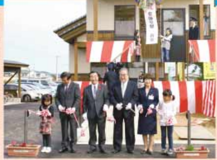
華々しくテープカットとくす玉割り