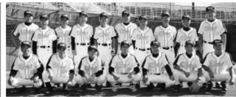
東北生涯野球大会に出場する由利クラブの皆さん