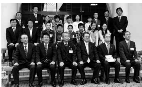
間伐材のベンチに座って記念の写真撮影