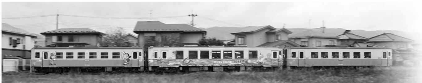
地域と共に走り続ける由利高原鉄道「おばこ号」