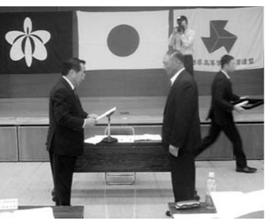
委員に委嘱状を手渡す長谷部市長