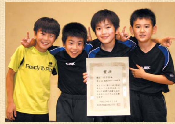
Vサインで喜ぶ鶴舞卓球スポーツ少年団メンバー