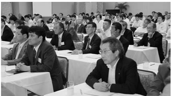
産業振興講演会で熱心に耳を傾ける本市とにかほ市の産業・行政関係者などの参加者