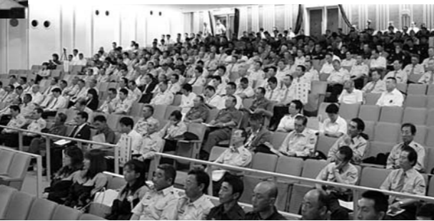
約600人が参加した県消防大会