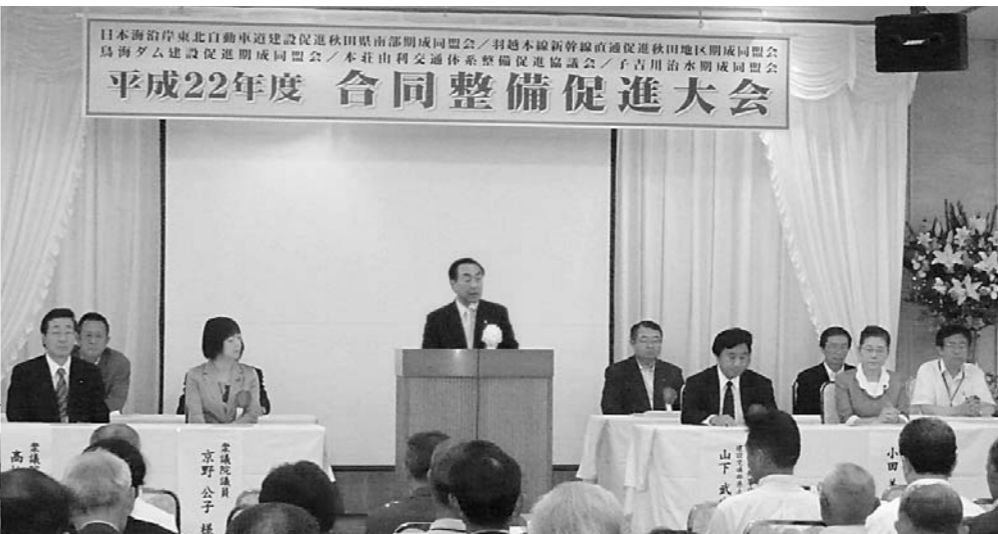
約300人が出席した5団体の合同整備促進大会

事業計画や予算を審議し、二路線の整備を促進させるための予算要望と合わせ、接続する主要地方道などの整備にかかる要望にも力を注ぐことを確認しました。