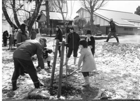
西滝沢水辺プラザで行われた植栽(3月29日)