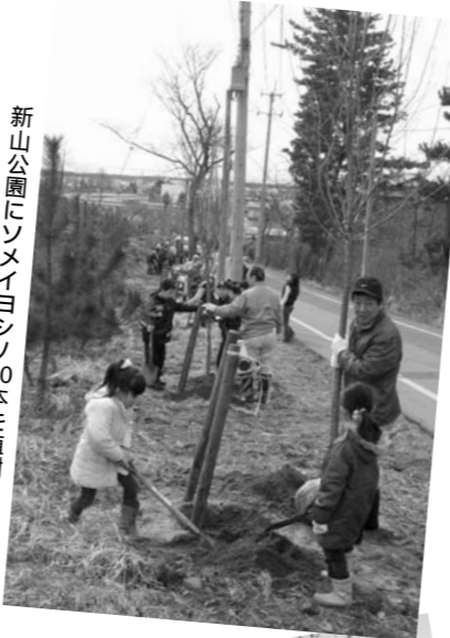
新山公園にソメイヨシノ20本を植栽(3月24日) 矢島駅前に桜並木の創出をめざして(昨年12月9日)