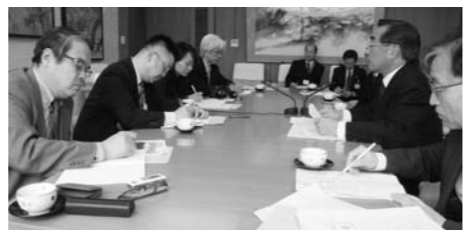
新聞社、通信社の記者の 皆さんの質問に回答 （先月21日）

ケーブルテレビ事業につきまし ては、本年度から新たなサービス としてデジタル放送のチャンネル 6でTBS系列の放送を送信する とともに、市内十八箇所に設置す る気象観測口ポットから、24時間 にわたりきめ細かな気象情報を提