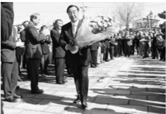
花束を受け取り初登庁 （昨年4月17日）