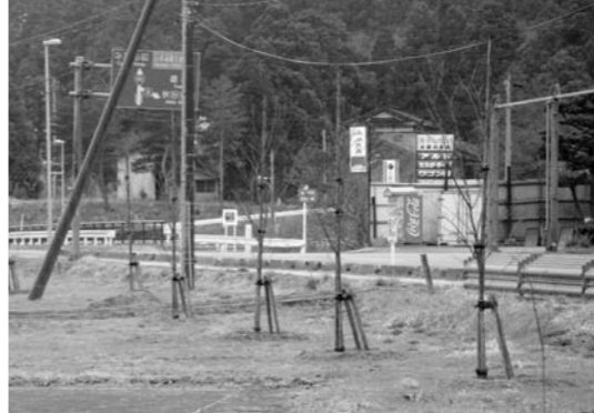
大内地域徳沢地区に植えられたサクラ