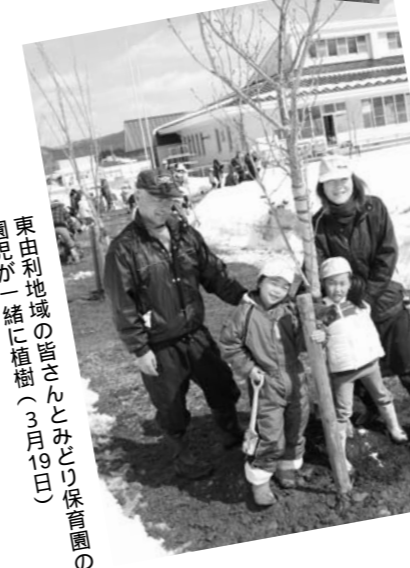
東由利地域の皆さんとみどり保育園の園児と一緒に植栽(3月19日) 鳥海地域の松ノ木パークに植えられたサクラ