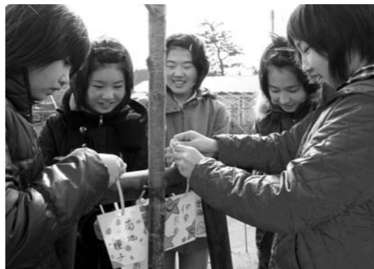
植栽したサクラに名札を付ける西目小6年生(3月12日)

この「ふるさとさくら基金」を通して、些細ながらも郷里の皆さんのお手伝いができることはこの上ない喜びであると同時に、遠い東京の空より郷里・由利本荘市のますますの発展をお祈りしております。