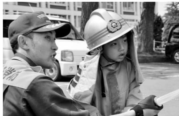
真剣な眼差しで放水の体験をする男児（5日）