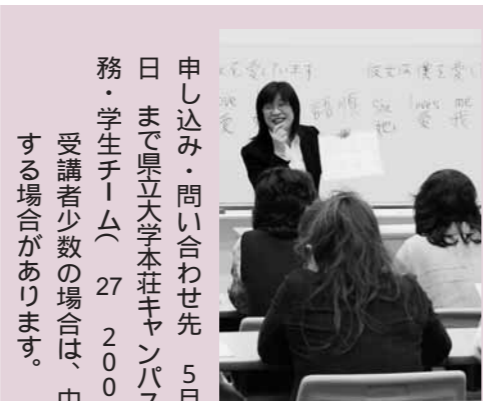
昨年の中国語教室で

地域連携・研究推進センターへの お問い合わせ 27 2947 / FAX 2945 E-mail: h_stic@akita-u.ac.jp H.P.: http://www.akita-u.ac.jp/stic/ 本荘キャンパス敷地内の東側の 大学院棟六階にあります。