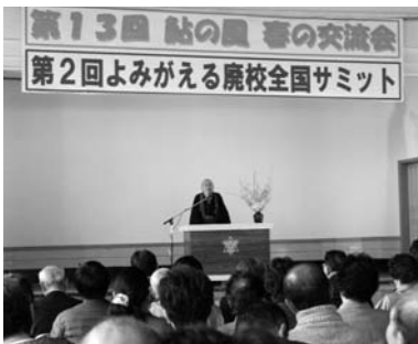
高井さんによる記念講演