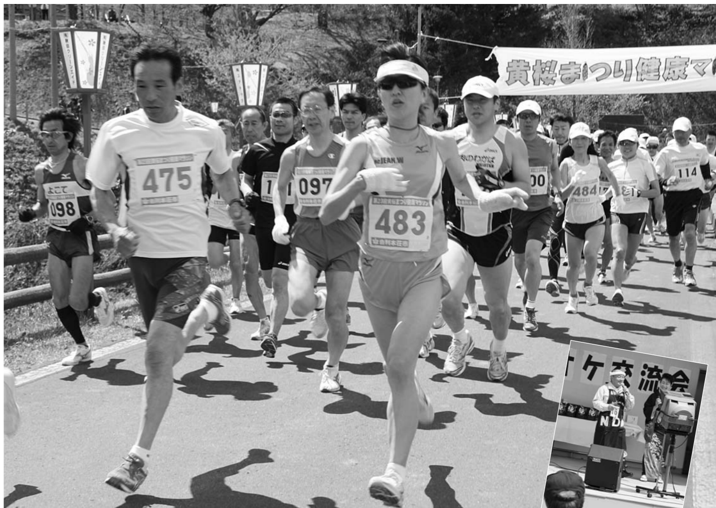
376人のランナーが出場した黄桜まつり・健康マラソン（9日）