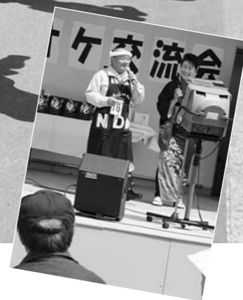
カラオケ愛好会の皆さんたちがのどを競った交流大会（9日）