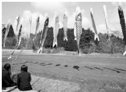
グラウンドの上を泳ぐ鯉のぼり