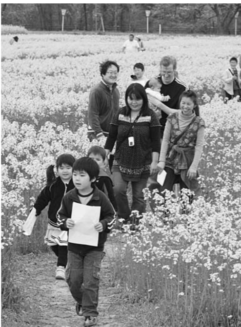
菜の花のジャンボ迷路を歩く家族連れ

各地域の行事を写真でお伝えします。さて、皆さんは今年春の訪れをどこで感じましたか。