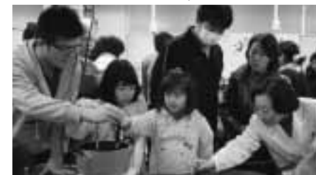
ろうそく作りを体験する子どもたち

上が本荘キャンパスの創造工房に集まり、楽しくにぎやかな一日となりました。 体験講座の準備をしたのは、漫画アニメ研究サークルの学生たち。バイオ燃料の研究をしている金澤先生(経営システム工学科)に講師を依頼し、