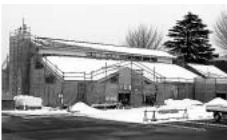
建設の進む西滝沢水辺プラザ

西滝沢水辺プラザ テナント出展者を募集中！ 4月にオープンする、にぎわいと憩いの施設「西滝沢水辺プラザ」にテナントを出店しませんか？ 業種 地域製品の生産・製造・販売、飲食施設の営業 テナント数 2店 面積 14.91平方m 使用期間 4月1日から1年間(更新可) 設備 照明、水道、流し台