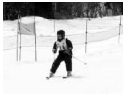
市内全域からのチビッコスキーヤーの参加をお待ちしています！

組別 キッズ、小・中学生、高校生、成年、壮年の年齢別（学年別）・男女別19組 詳細は問い合わせください。 なお、当日受け付けはいたしません。 申し込み・問い合わせ先 2月22日（月）まで、日新館（矢島教育学習課 56 2203）