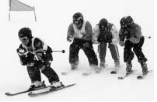
ひとかたまりになってコースを滑走接触して転倒することもしばしば(写真は昨年の大会、スキークロスの部)

4人の選手が同時にスタートし勝敗を争うスキークロス、スノーボードクロス、スキーボードクロス、スキーボードの3部門で行われるトリナメント方式のクロス競技大会。申し込みは2月17日(水)までですが、われ先にとコースを駆け抜ける選手たちに熱い声援を送ってください。 とき 2月27日(土)8時～受け付け、8時45分～開会式、10時～競技開始 ところ 鳥海高原矢島スキー場クロスコース 参加定員 各部門50人