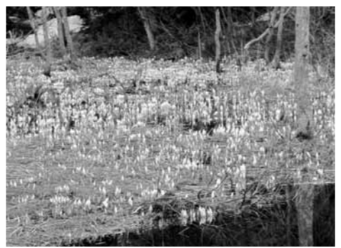
ミスバショウの群生地(昨年撮影)

「三望苑」オープンしました 多くの皆様のご利用をお待ちしています。なお、本年度の本荘マリーナオートキャンプ場は、営業期間を7月～