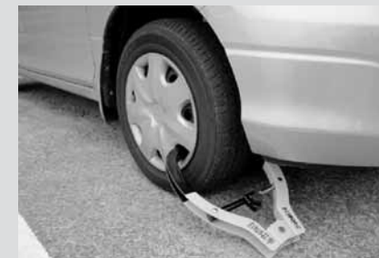
車両の差し押さえに使用するタイヤロック機材

税金は暮らしやすい豊かなまちづくりのための大切な財源です。市では、納税の公平性を確保するため、収納対策を一層強化しています。