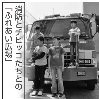
消防とテビッコたちとの「ふれあい広場」