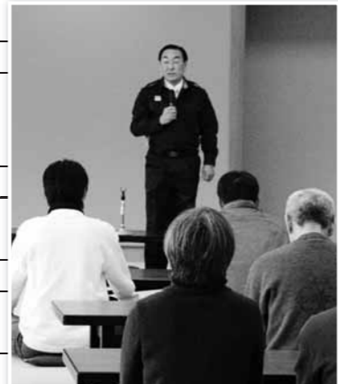
市で受け入れた被災者を激励（22日）