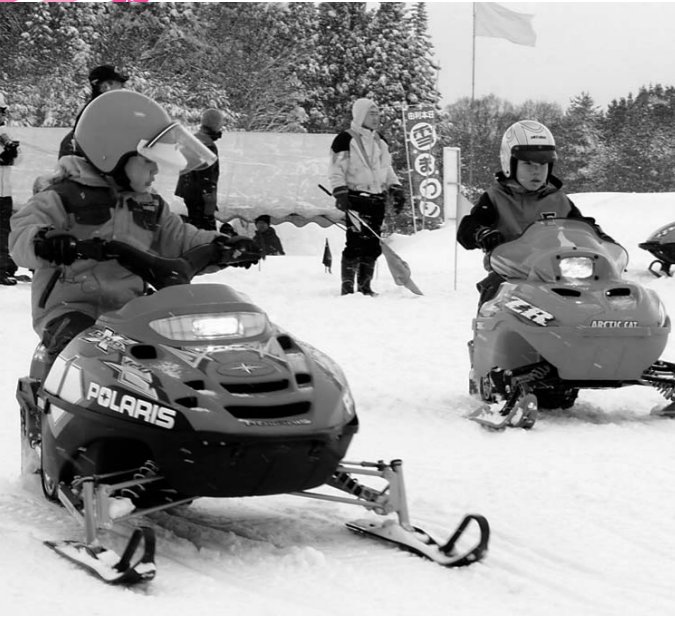
かっこよくスノーモービル体験試乗「雪まつりin鳥海高原」