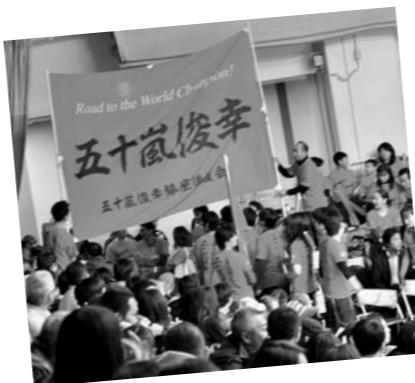
後援会ののぼりに迎えられ