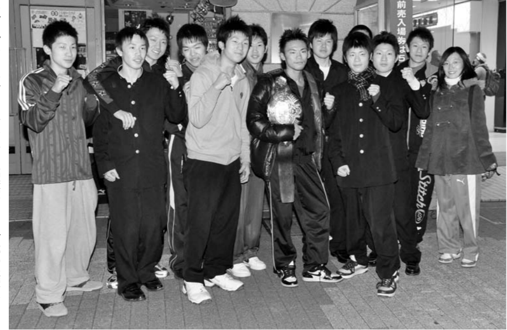
チャンピオンベルトを手に、西目高校ボクシング部の後輩たちと