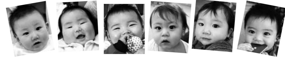
みんないい笑顔 ☺ (2月22日、4・7・10か月児健診 由利福祉保健センター)