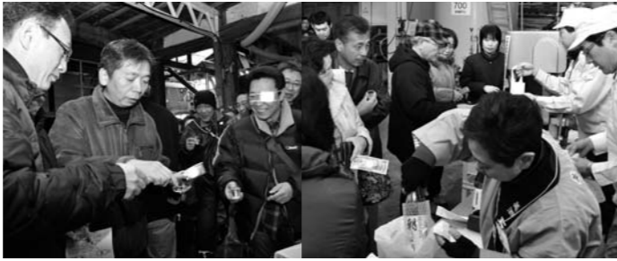
やしま冬まつり&酒蔵開放

新山小学校水泳部、川内卓球男子スポーツ少年団、鶴舞卓球男子スポーツ少年団、新山女子ミニバスケットボール少年団、小友唯心塾、岩城ジュニアシャトルスポーツ少年団、由利中学校サッカー部、本荘東中学校男子ソフトボール部、本荘北中学校男子ソフトボール部、本荘南中学校ポルト部男子ダブルスカルA、本荘南中学校ポルト部男子ダブルスカルB、本荘南中学校ポルト部男子、本荘南中学校ポルト部女子(敬称略)