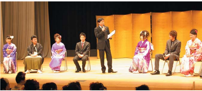
新成人が将来像や地域への思いなどを語った「トークショー」