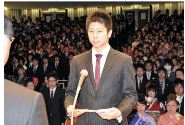
吉尾さんが新成人代表あいさつ