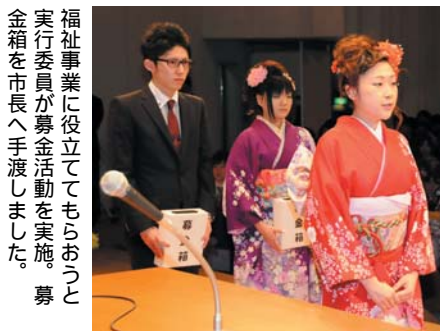
福祉事業に役立ててもらおうと、実行委員会が募金活動を実施。募金箱を市長へ手渡しました。