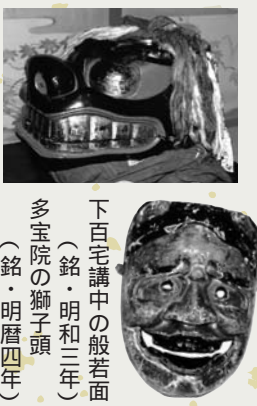
下百宅講中の般若面(銘・明和三年) 多宝院の獅子頭(銘・明暦四年)

獅子頭や面、幕、史料価値高い道具 獅子舞番楽に使用する道具類は、鳥海地域に歴史的価値の高いものが数多く残されています。主なものでは、明暦四年(一六五八)、元禄十五年(一七〇二)の獅子頭、明和三年(一七六六)と文政二年(一八一九)の番楽面や武士面、また延享四年(一七四七)、寛政八年(一七九六)の番楽幕などが残されており、いずれも市の有形民俗文化財に指定されています。