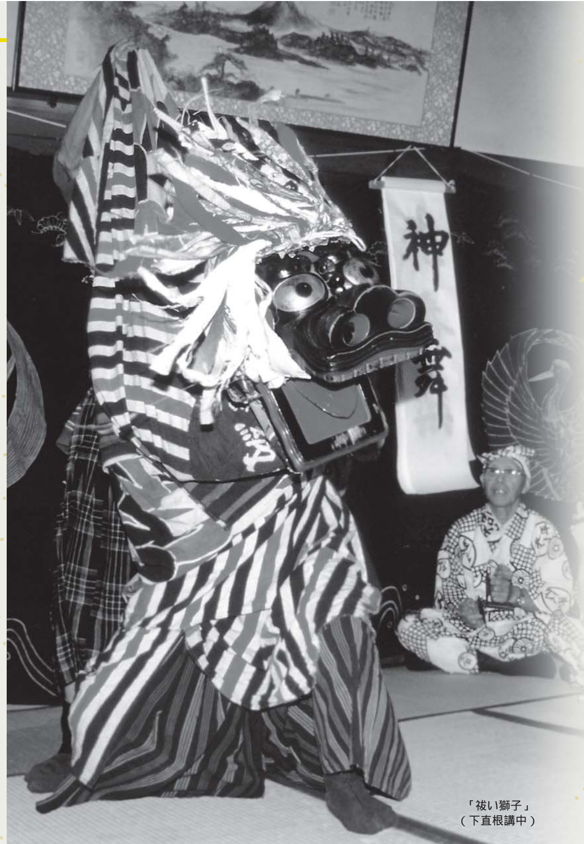
「被い獅子」(下直根講中)

重要無形民俗文化財とは四季折々の祭や年中行事などの風俗慣習、民俗芸能、民俗技術など、日本の風土に生まれ、世代を超えて伝えられてきた無形の文化財のうち、特に重要なものを国が指定し保護を図るものです。 現在、県内には大日堂舞楽(鹿角市)や竿燈(秋田市)、西馬音内盆踊り(羽後町)など、十五件があります。 国指定文化財、市内に2件 市内にある国指定文化財は、次の二件です。 重要文化財(建造物) 「土田家住宅」(矢島地域・昭和四十八年指定) 史跡 「鳥海山」(平成二十一年指定)、「森子大物忌神社境内(由利地域)」、「木境大物忌神社境内と道者道(矢島地域)」