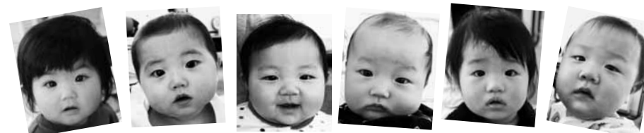
すくすく育てね（1月25日、4・7・10カ月児健診 矢島保健センター）