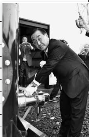
猿倉温泉3号井の井戸元バルブを開栓（22日）