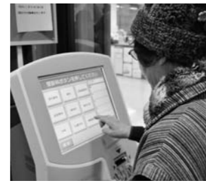
運用を祝いテープカット(上) 早速、受付機の操作へ(下)

由利組合総合病院の遠隔受診受付システム「院外用再来受付機」の運用が十二月二十七日から始まり、同日の朝、JA秋田しんせい矢島総合支店でシステムの竣工式が行われました。