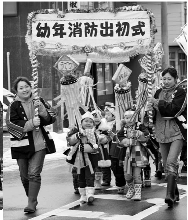
行進を先導する内越保育園児たち