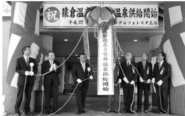
くす玉を開き、拍手で祝って

鳥海地域猿倉温泉の新しい源泉「3号井」の引湯式が十二月二十二日、ホテル「フォレスト鳥海」で行われ、県や市関係者など約二十五人が出席して供給開始を祝いました。これまでは休養宿泊施設「鳥海荘」と共に、平成二年に掘削した2号井を利用してきましたが、近年は湯量が減少、将来的な安定供給を図るため、昨年度の事業で地下千五百メートルで掘削し、約52度の新しい源泉の揚湯に成功していました。3号井では毎分百六十リットルの湯が出ており、成分は2号井とほぼ同じ。3号井は「フォレスト鳥海」、2号井は「鳥海荘」で利用されています。