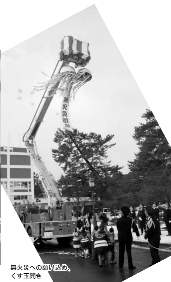
無火災への願い込め、くす玉開き