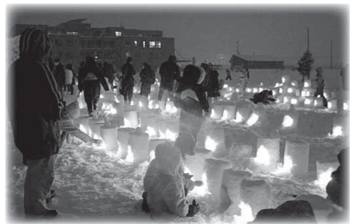
一昨年のポップ・ステップ・キャンパス