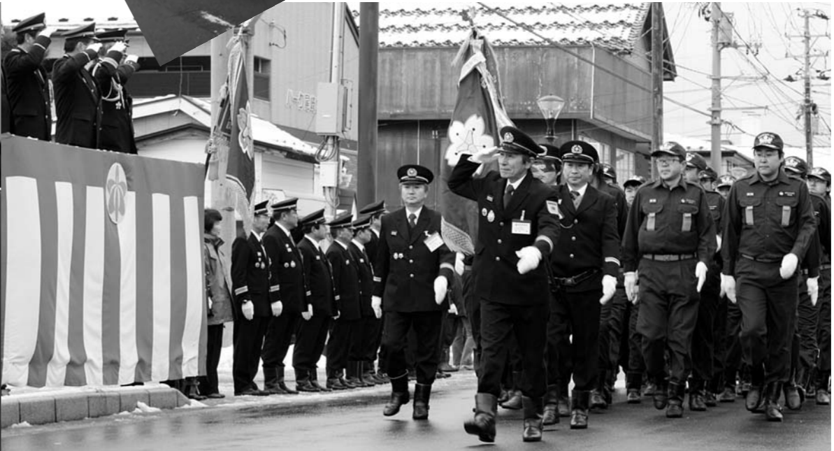
地域を守る各支団の精鋭が行進