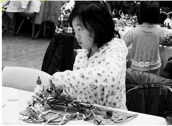
リボンや毛糸を巻いてリースを飾りつけ