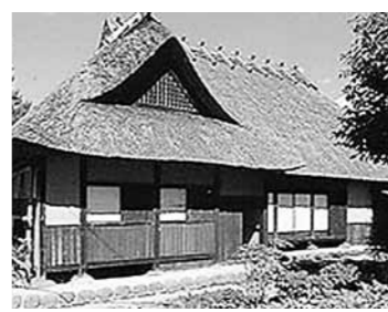
国指定重要文化財「土田家住宅」

国指定重要文化財「土田家住宅」で防火訓練(文化財防火デー) 消防庁と文化庁が定めた「文化財防火デー」に合わせ、矢島地域の国指定重要文化財「土田家住宅」で防火訓練を実施します。訓練の様子を見学し、防災意識の再確認をしてみたいかがでしょうか。 日時 1月26日 午前9時30分 問い合わせ先 矢島教育学習課 56 2203