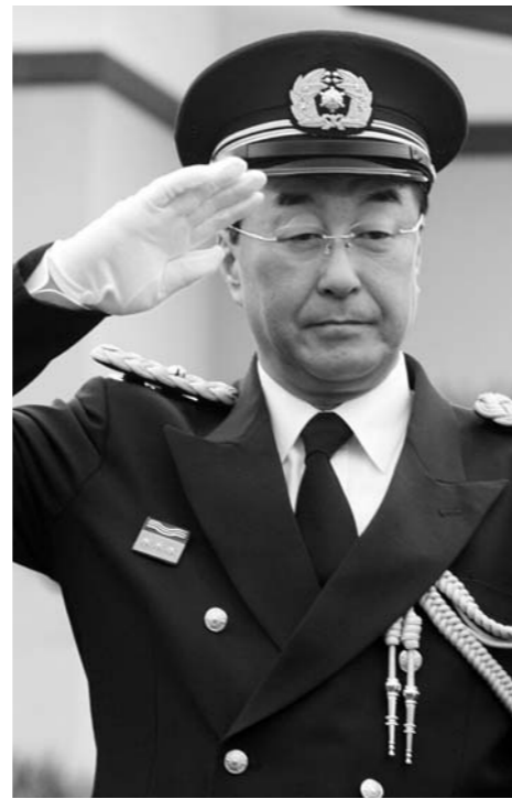
観閲する統監(長谷部市長)