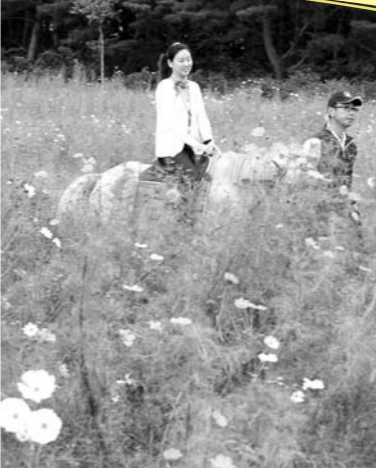
コスモス畑での乗馬体験

南由利原青少年旅行村で10月7日、南由利原コスモスまつりが市観光協会由利支部の主催で行われました。訪れた