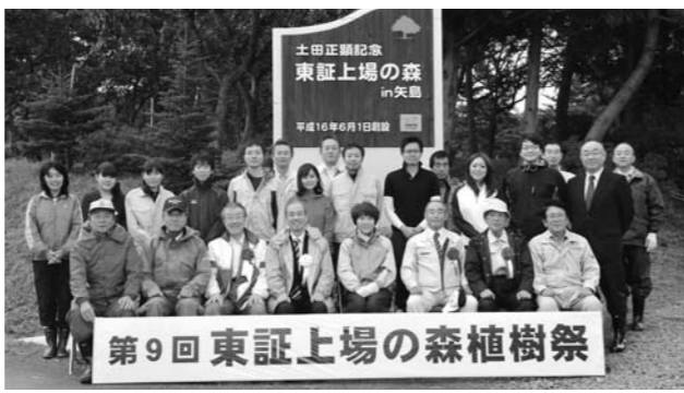
第9回東証上場の森植樹祭

株式会社東京証券取引所では、初代社長が矢島地域の出身であることを縁に、花立牧場内に「東証上場の森」を設け、平成16年から毎年植樹を行っています。