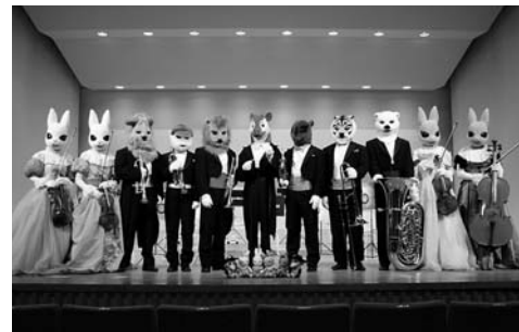
「ズーラシアンブラス」と「弦うさぎ」

日時 11月23日(金) 17時〜(16時半開場) 会場 カダール 大ホール 入場料 1500円(前売千円) 内容 「コッペリア」全幕より抜粋・小作品 問い合わせ先 本荘バレエスタジオ ☎22-0127