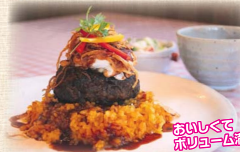
秋田由利牛ハンバーグ ロコモコ風

■メニュー ●比内地鶏のトマトソース煮 ●秋田由利牛ハンバーグ ●ロコモコ風(一番人気!) ●鳥海ポークハープ粉焼き丼