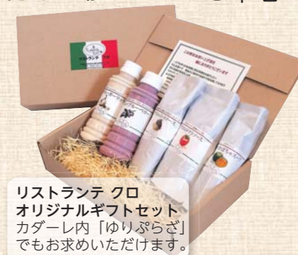
リストランテ クロ オリジナルギフトセット カダーレ内「ゆりぶらざ」でもお求めいただけます。

このコーナーでは、市商工会に加盟している市内各地域の「人気のお店」、「頑張る会社」を紹介しています。第11回は、本荘地域の「リストランテクロ」です。