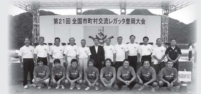
全国市町村交流レガッタ豊岡大会 本市出場チームを激励(29日)