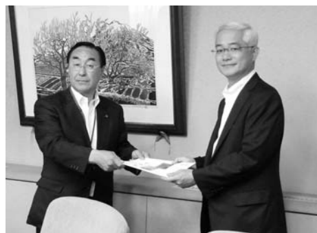
徳山国土交通省東北地方整備局長