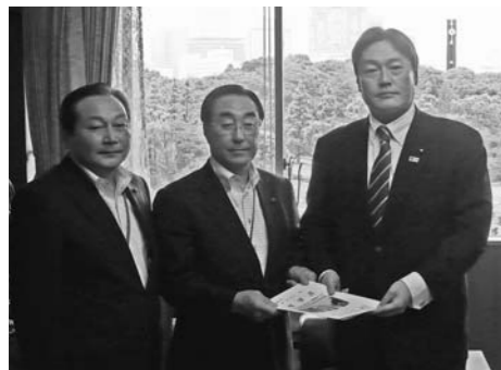
吉田国土交通省副大臣