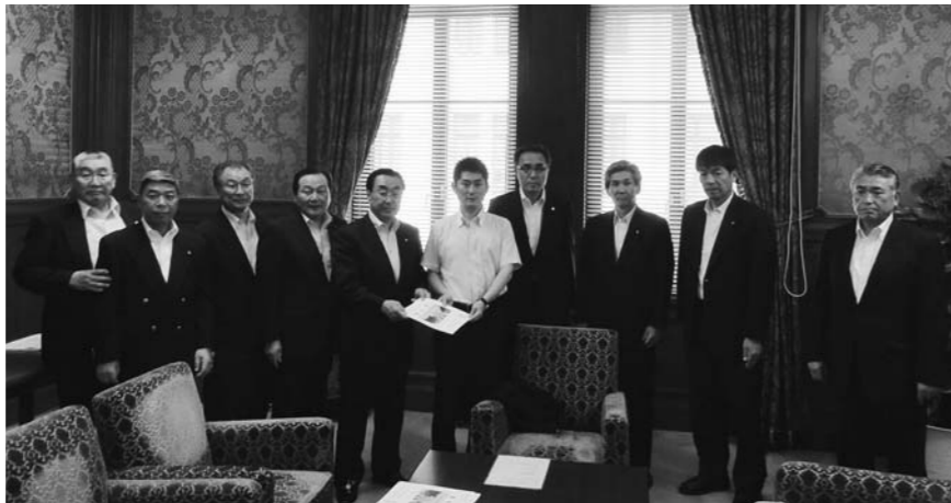
国会要望（松浦陳情要請対応本部副本部長）