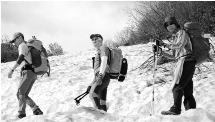
日本でも人気の韓国ドラマ「宮廷女官チャングムの誓い」に王様役で出演した林湖(イム・ホ)さんも同行(写真中央)

登山やトレッキングがブームとなっている韓国から登山愛好者25人が鳥海山登山に訪れ、本市に滞在しました。これは、昨年10月に長谷部市長が韓国と台湾の旅行代理店を訪問し鳥海山を売り込んだことがきっかけとなっており、ソウルの旅行会社が企画しました。一行は、秋田ソウル定期便を利用して6月30日に本市入りし、翌1日に登頂。祓川(矢島口・5合目)から入山し、鉾立(象潟口)へ下山しました。