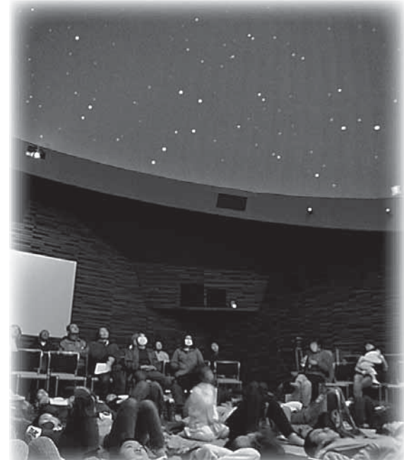
昨年のプラネタリウム教室 (寝ころんで観賞する場合、枕になるものがあると便利!)

【春の天体観望会】 日時 5月26日 19時～21時 会場 カダーレ2階屋上 内容 春の星座と惑星たち 集合場所 カダーレ西口駐車場付近