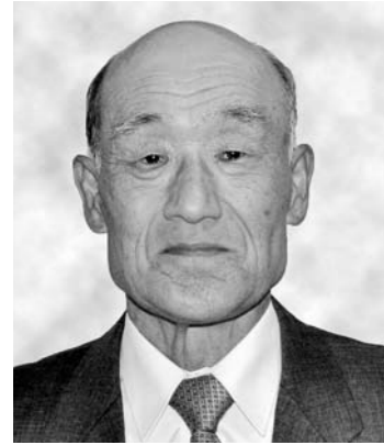
藍綬褒章 統計調査功績

このほど、「春の叙勲」「春の褒章」「危険業務従事者叙勲」が発表され、本市関係では9人の方々を受章しました。