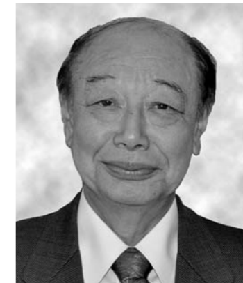
瑞宝小綬章 教育功勞