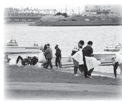
昨年の子吉川クリーンナップ