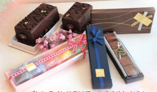
バレンタインに向けて、おすすめします!

■喜び・楽しみ なにより、お客さまに喜んでいただけること。商品が売れて、リピーターが増えること。若いスタッフの成長。新商品の開発。