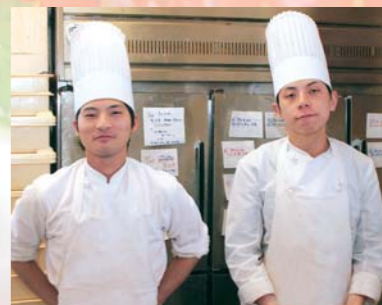
「ていねいな仕事を心がけています!」

品の研究に熱を注ぎ、レパートリーは100種を超えています。季節に合わせて新作を出していて、現在はバレンタイン向けの商品「生チョコ」や「アルハンブラ」が人気です。(写真/左)