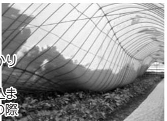
雪下ろし作業は気温上昇前に

○除雪作業は複数人で行う ○高所での除雪作業は、ハンゴをしっかりと固定し、命綱をつけて作業を行う ○除雪機を使う場合は、ローターに巻き込まれないよう注意し、点検・調整などの際は必ずエンジンを止めて行う