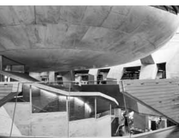
カダーレのプラネタリウムへぜひおいでください(2階通路から見た球体(プラネタリウム))

日時 1月14日 午後2時～3時 会場 カダーレ3階 自然科学学学習室2 内容 一等星が多く輝く冬の星座たち 申し込み・問い合わせ先 前日まで、市理科教育センター 3166