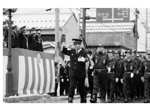
消防団員による分列行進

保育園児による防火パレード 間帯は車両通行止めとなります。ご協力をお願いします。 区間 市役所前市道(ガスイ道局・ローソン) 時間 9時～10時30分ごろ 問い合わせ先 消防本部総務課 4282