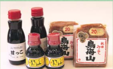
※写真はイメージです。実際の賞品とは異なります。

※個人情報記載内容の確認、プレゼントの発送のために使用し、この目的以外には使用しません。