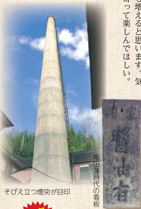
そびえ立つ煙突が目印