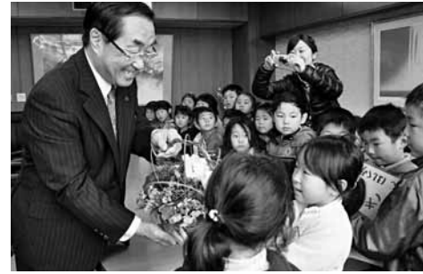
本荘保育園の5歳児が勤労感謝の日の訪問でお花をプレゼント(14日)