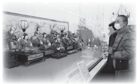
昨年のおひなさまの展示(矢島郷土資料館) 今年も2月10日から展示を行います

「子ども手当」の請求手続きはお済みですか? 昨年10月分から本年3月分の子ども手当を受給するためには請求手続きが必要です。昨年10月分から本年1月分の支給予定日は「2月7日」です。この支給日に間に合わせるためには、1月13日までに請求手続きを終えてください。 なお、昨年10月分から子ども手当の受給資格がある方は、3月30日までの申請で、遡つ