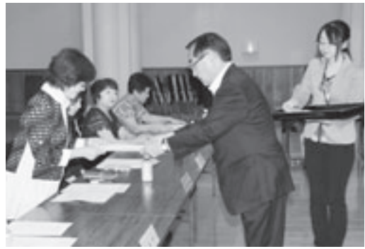
各委員に委嘱状が手渡されました

市では、市民と行政との協働によるまちづくりを推進し、地域の課題解決および活性化を図るため、市の各地域に「まちづくり協議会」を設置しました。