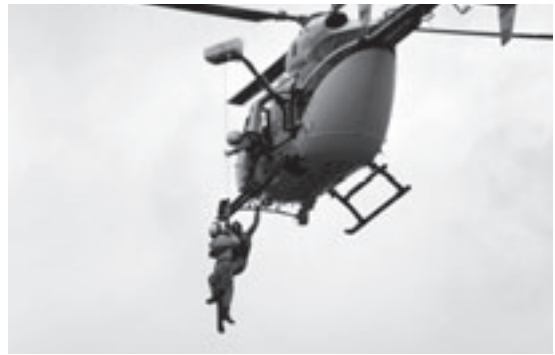
ピックアップ救助訓練