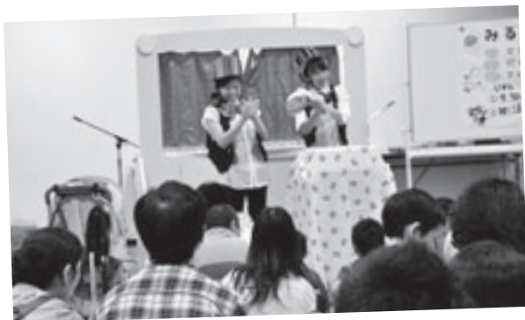
楽しいマジックショー

本荘地域内の保育園児や保護者の交流を図ろうと、第25回本荘地区保育園こどもフェスティバル（本荘地区保育園連絡協議会主催）が8月31日、カダーレで開催されました。遊びや給食、出店などのコーナーが保育士らにより設けられ、会場は多くの親子連れでにぎわいました。 また、ステージでは園児による合唱、保育士によるダンスなどが披露され、来場者大いに楽しませていました。