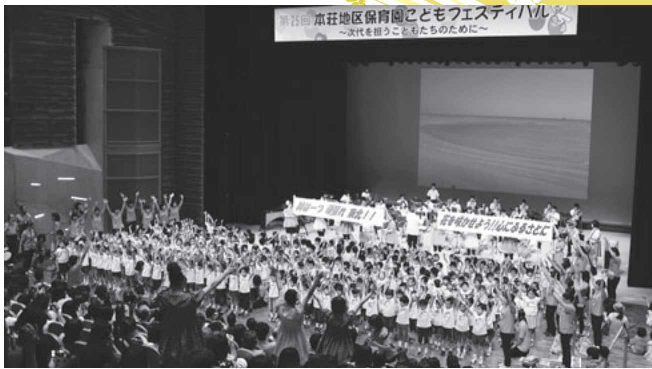
由利高校吹奏楽部の演奏にのせて来場者全員で歌った感動のフィナーレ

本荘地域内の保育園児や保護者の交流を図ろうと、第25回本荘地区保育園こどもフェスティバル（本荘地区保育園連絡協議会主催）が8月31日、カダーレで開催されました。遊びや給食、出店などのコーナーが保育士らにより設けられ、会場は多くの親子連れでにぎわいました。 また、ステージでは園児による合唱、保育士によるダンスなどが披露され、来場者大いに楽しませていました。