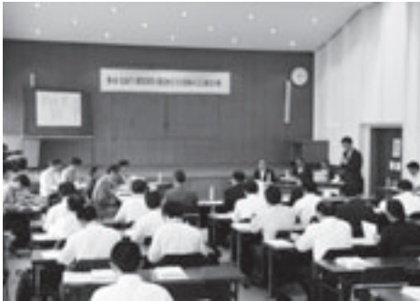
6月に開催された第4回「検討の場」

鳥海町百宅地区に建設が計画されている「鳥海ダム」は、建設の是非を検討する「ダム検証」の対象となっており、これまで国、県および本市による「検討の場」などにおいて検証作業が行われてきました。国土交通省は8月23日、実現性やコスト面などから「ダム建設が最も有利」とする東北地方整備局の報告を踏まえ、「鳥海ダム建設事業」