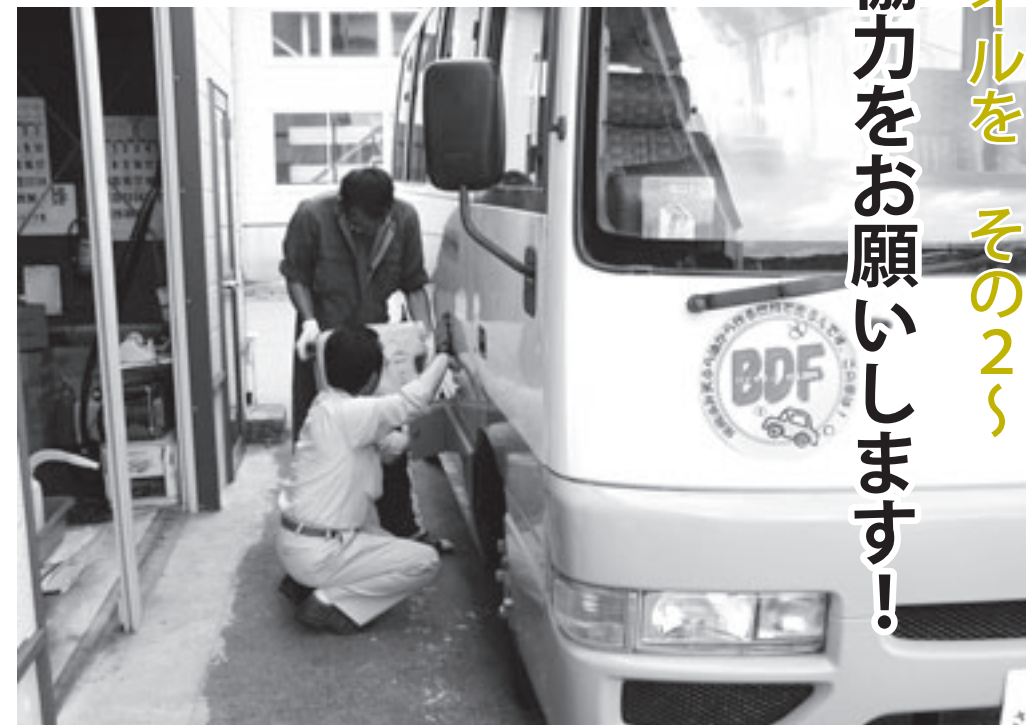
自社バスへの給油作業(長田建設)

※BDFとは・・・ 料理などで使った植物性の廃食用油や期限切れの食用油をリサイクルすることにより、ディーゼルエンジンに使用可能な『バイオディーゼル燃料』に転換したものです。燃焼により排出される二酸化炭素は、もともと植物が大気から取り込んだ炭素が再び大気中に戻っていくものであることから、二酸化炭素の増減に影響を与えない資源とされており、地球温暖化防止の効果が大きいとされています。