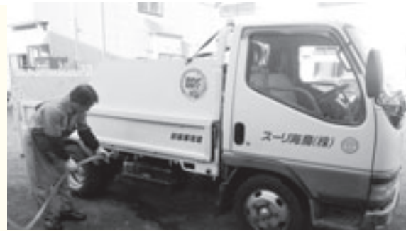
自社トラックへの給油作業(鳥海リース)

【訂正】 9月1日号「図書館Information」コーナー・9月の行事カレンダーの掲載に誤りがありました。開始時間を次のとおり訂正します。 28日(土)(由)民話紙芝居上演:午後1時半～