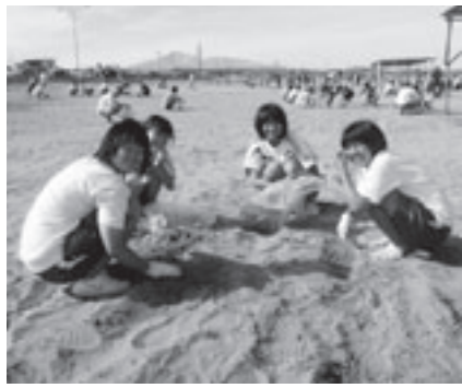
たくさん参加者が木の枝などのごみを拾う

市内の道川、本荘マリーナ、西目の各海水浴場が海開きを迎えた7月20日、本荘マリーナ