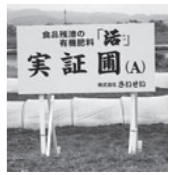
特殊肥料の実証農園

市では、今後とも頑張る企業によるリサイクル活動、環境保全活動の支援に取り組んでいきます。 問い合わせ先 生活環境課エコ対策推進室 ☎24-6269、(株)さいせい http://www.saisei-akta.co.jp/products.html