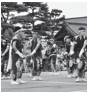
熱演する「チーム・じゃんがら」

「道川百姓踊り」、「亀田手踊り」、「亀田大神楽」が競演し会場を大いに盛り上げました。 また、福島県いわき市からはいわき海星高校の「チーム・じゃんがら」が参加し、「じゃんがら念仏踊り」を披露しました。 また亀田体育館では旧藩芸術文化交流展が同時開催され、多くの作品が観客の目を楽ませていました。