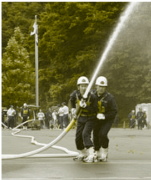
真剣な表情で取り組む団員

市消防訓練大会が7月14日、県消防学校（岩城内道川）で開催され、約300人の消防団員が日頃の訓練の成果を競いました。