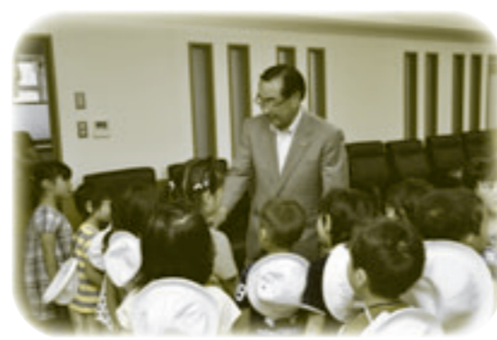
本荘幼稚園の園児が「花の日」に訪問（13日）