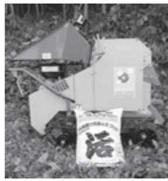
竹の粉砕器と特殊肥料「活」

市内のスーパーから回収されるこれらの生ごみは肥料として生まれ変わり、今では県のリサイクル製品認定を受けています。当初はなかなか使ってもらえず苦労の連続だったそうですが、無料サンプルの配布、販売と営農指導