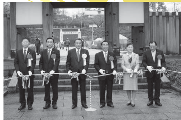
本荘さくらまつりオープニング