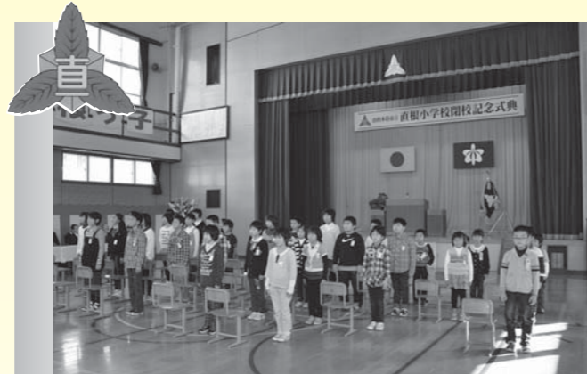
直根小学校の閉校式