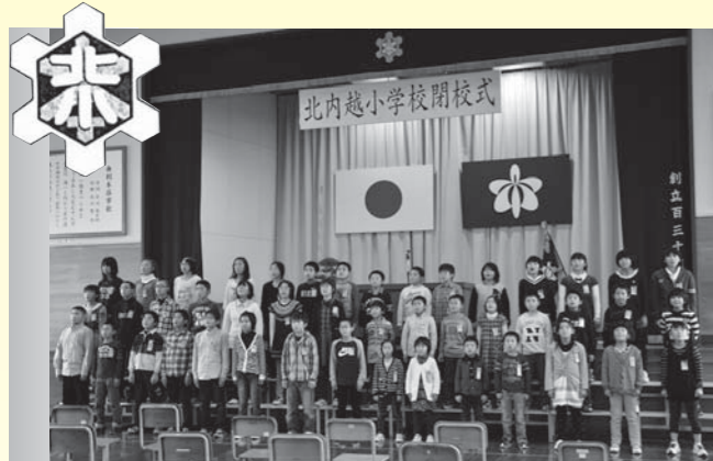
北内越小学校の閉校式

北内越小学校は新山小学校に、鳥海地域の3小学校は鳥海小学校にそれぞれ統合されました。