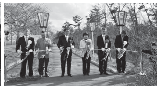
桜・菜の花まつりオープニング