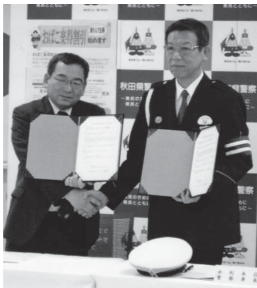
春田社長(左)と小川署長

【割引期間】平成26年3月31日まで くわしくは由利高原鉄道(株) 56-2036へ