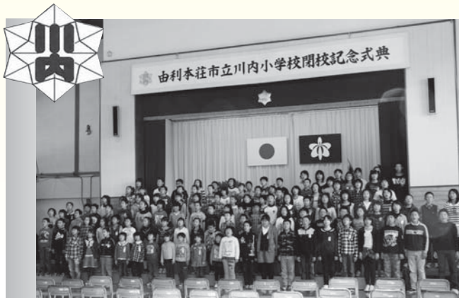
川内小学校の閉校式