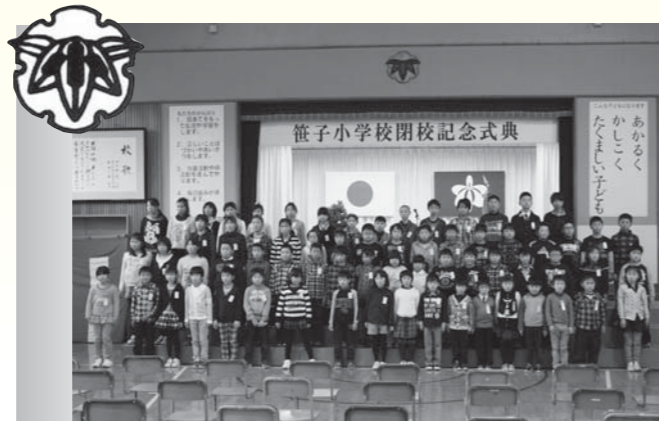
笹子小学校の閉校式