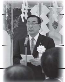
鳥海小学校竣工修祓式にて(12日)