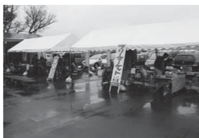
水辺プラザさくらまつり