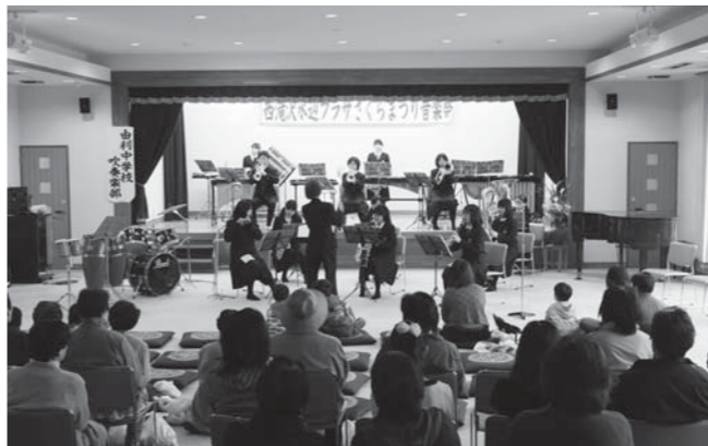
由利中学校吹奏楽部による水辺音楽祭