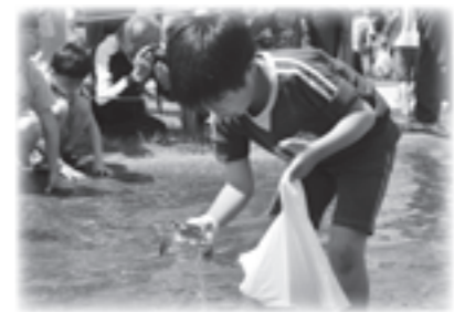
昨年ガニまつりの様子

方はお問い合わせください。実施地域 旧ソ連、中国、インドネシア、東部ニューギニア、ミャンマー、フィリピン、硫黄島ほか 問い合わせ先 県福祉政策課 保護・援護班 ☎018-860-1318