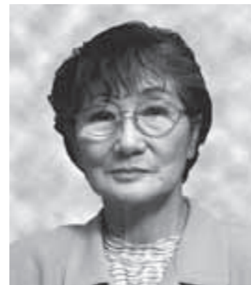
藍綬褒章 行政相談功績

このほど、「春の叙勲」「春の褒章」「危険業務従事者叙勲」が発表され、本市関係では6人の方々が受章しました。