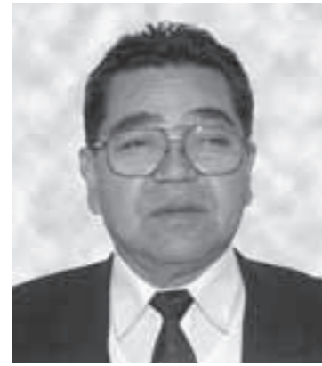
旭日双光章 地方自治功労