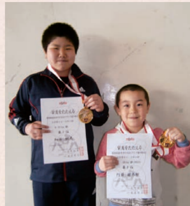
左から細谷くん、阿部くん