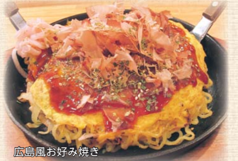
広島風お好み焼き

日替わりサービスマンランチ(月)金は、500円。宴会のほか、お持ち帰りもできる。メニューが多く、迷った時は人気ランキングを参考に注文するのもおススメ。