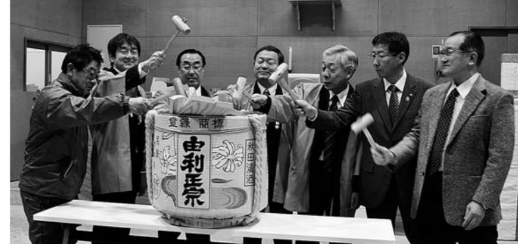
あきた総合家畜市場 初セリで鏡開き(8日)