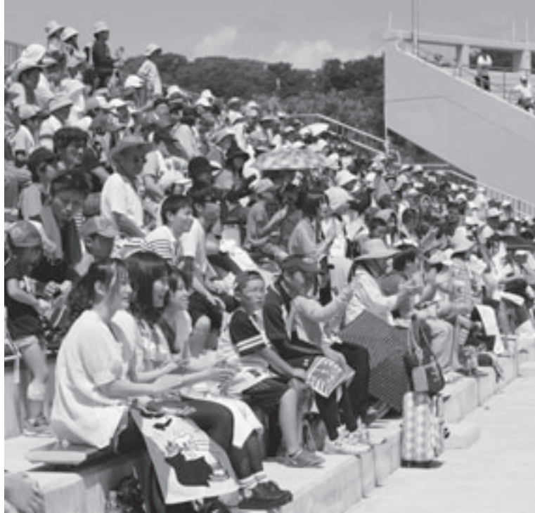
巨人の得点に拍手を送る1塁側スタンド