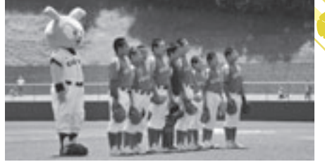
本荘由利リトルシニアの選手たち