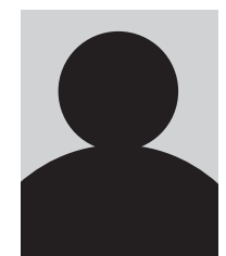
氏名、年齢、大字 ※年齢は8月1日現在