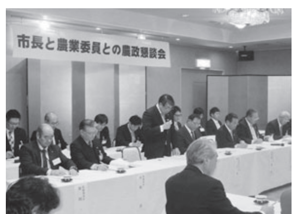
市長と農業委員との農政懇談会（H26年1月）

具体的には、農地法に基づく許認可制度の適正執行、農地パトロールの実施、農業委員会だよりなどによる情報提供活動の展開ならびに農業施策に対する建議・要望などを行っています。