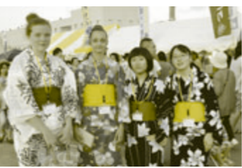
浴衣姿で花火見物に出発した。帰国の途に就きました。

とてもおいしかったです」と話していました。8月5日に本市を出発した一行は、都内を視察した後、