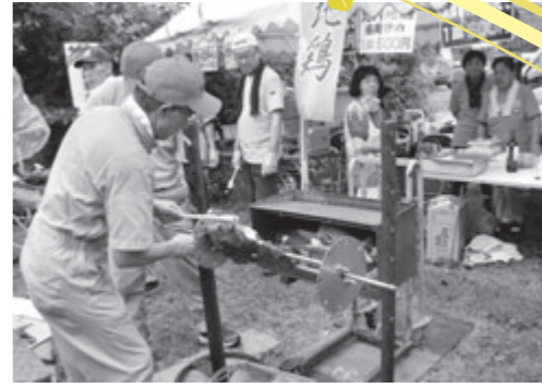
迫力の「秋田由利牛の丸焼き」

南由利原青少年旅行村で8月9日、「鳥海高原由利原まつり」が開催されました。まつりには時折雨の降るあいにくの天気にもかかわらず、約1万5千人の来場者が訪れ、日中は秋田由利牛フェアの焼肉ガーデン、夕刻からは「高原音楽祭」を楽しみました。音楽祭第1部は地元愛好家