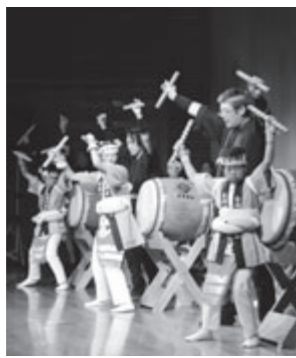
にかほ市 金浦神楽