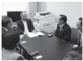
森北国交省水管理・国土保全局長