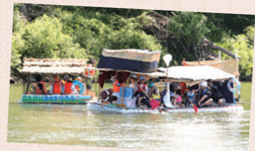
子吉川いかだ下り大会