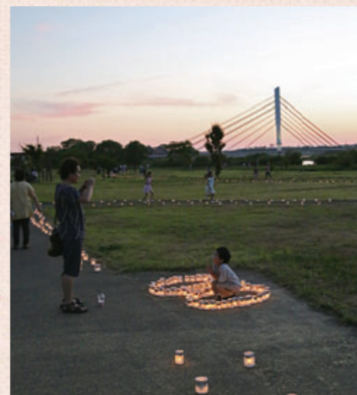
夕暮れのせせらぎパーク(キャンドルナイト)