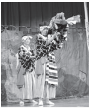
本海獅子舞番楽「平根講中」