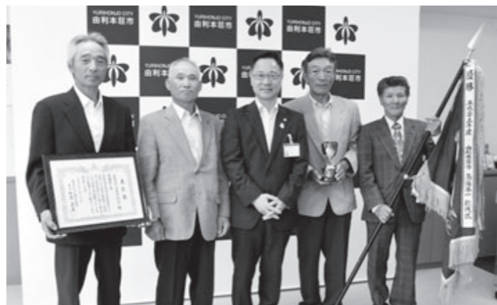
喜びの鳥海町葉たばこ振興会の皆さん