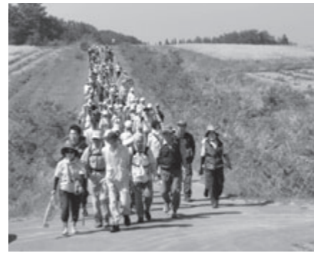
菜の花畑でのウォーキング

第5回鳥海高原菜の花まつり（同実行委員会主催）が5月31日・6月1日、矢島町桃野地区で開催されました。菜の花が咲き誇る会場では、菜の花摘み取り体験や県立大生、由利本荘・にかほ地域の高校生ボランティアによるピンホールカメラや菜の花キャンドルなどの工作教室のほか、ナタネ搾油体験やBDF製造実演などが行われ、多くの家族連れでにぎわいました。