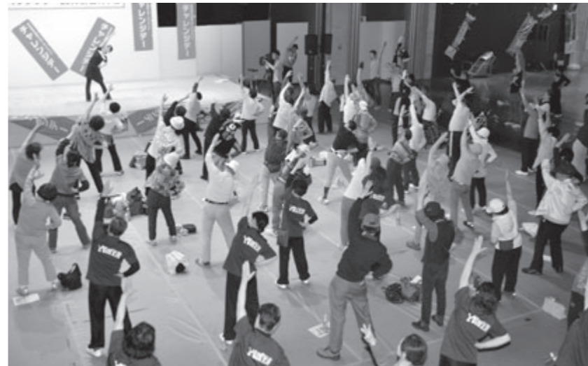
みんなストレッチ（カダーレ）

「スポーツの力で日本を元気に！」をスローガンに掲げ、5月28日に開催された「チャレンジデー2014 in 由利本荘」では、市内各地でスポーツイベントが行われ、多くの市民がスポーツに親しみました。