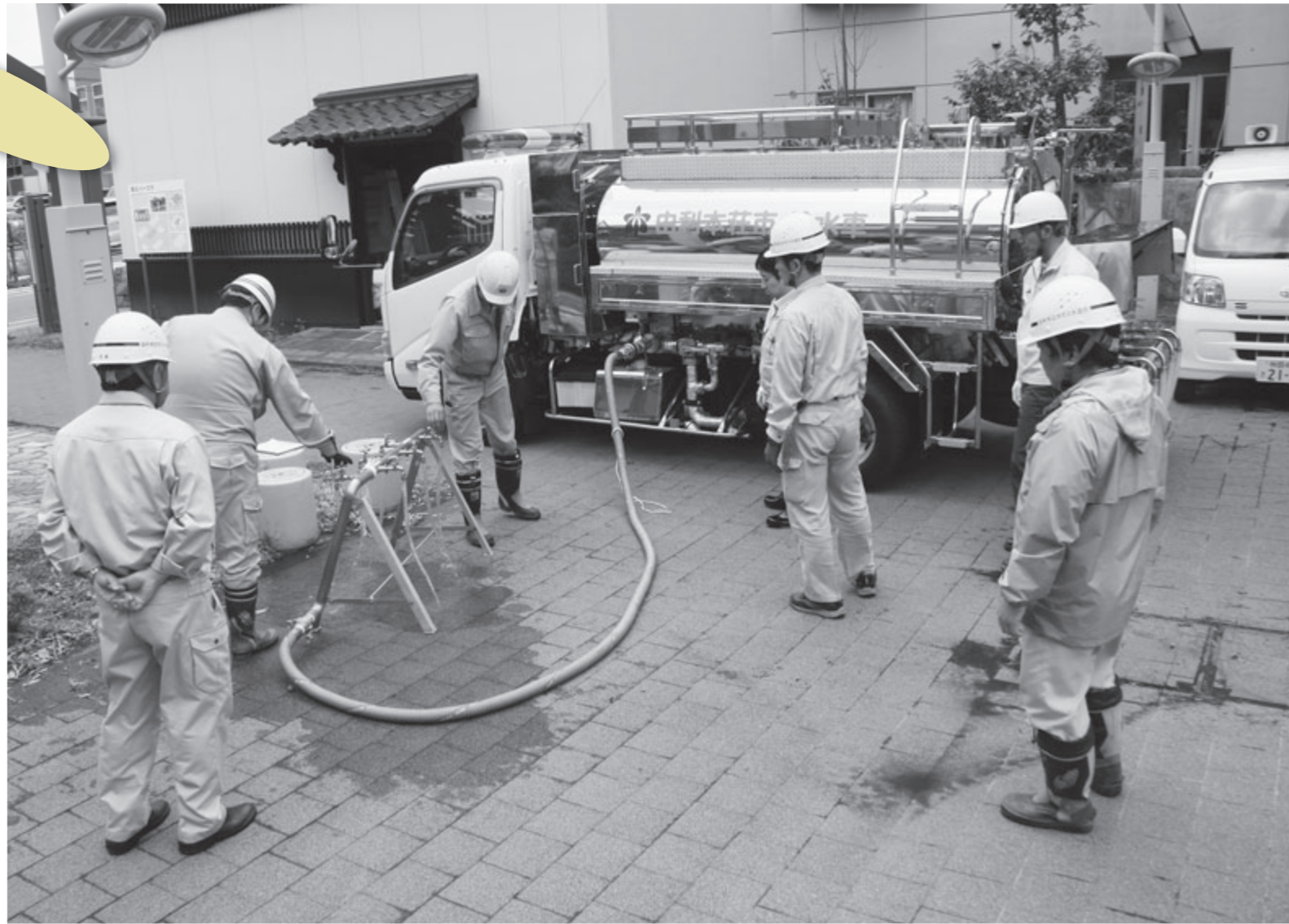
本荘中央防災公園での給水訓練

応急給水タンクの導入により、容量の大型化と給水口が多くなったことから給水所での給水活動が便利になります。また、タンクはトラックに積載可能なため簡易給水車としての使用もできるほか、応急給水栓は消火栓に直接接続できるため、状況に応じた給水活動が可能となります。