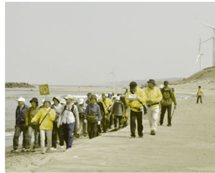
フットパスの問い合わせ先 市国民文化祭事務局 ☎24-6299

市の街並みや史跡、自然を見て歩くフットパス「鳥海さんぼ」が4月26日からいよいよ開催され、初日となるふるさと再発見コース「西目」には37人が参加しました。 参加者たちは道の駅に集まり、日本の白砂青松百選に選定されている西目海岸のほか、縄文時代のヤマトシジミが出土した坊主森貝塚、ハーブワールドやその周辺を巡る4・6キロの道のりを約2