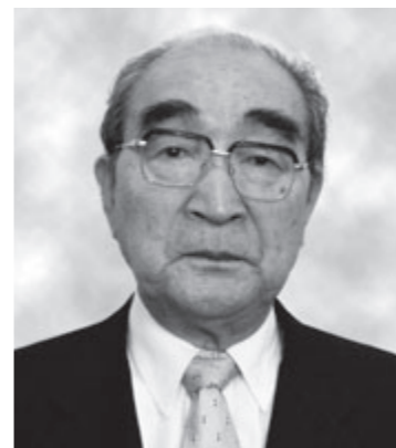
◆瑞宝双光章 郵政事業功勞

このほど、「春の叙勲」「春の褒章」「危険業務従事者叙勲」「高齢者叙勲」が発表され、本市関係では6人の方々が受章しました。