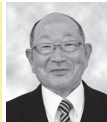
◆旭日双光章 地方自治功勞

「家族や消防団員の支えを得られ、受章できたものと感じています。周囲の方々には心から感謝申し上げます」と話す原さん