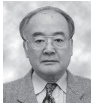
◆黄綬褒章 業務精励