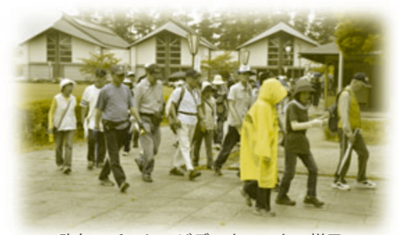
昨年のチャレンジデーウォークの様子

診察室改装工事のため、次の期間救急患者の受け 入れを含む外来診療を休診します。 休診期間 3月24日(月)～4月2日(水) ※休診期間中にお手持ちの薬が不足しないよう十分ご 注意ください 問い合わせ先 鳥海診療所 ☎57-2003