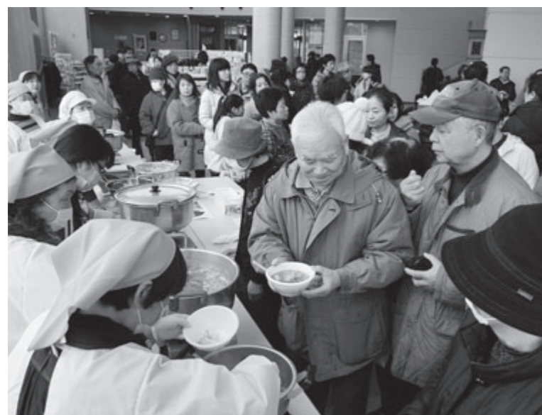
大にぎわいの特設会場

地元食材でにぎわいを創出しようと2月11日、ぽぼろつこ特設会場で「大内うめえものまつり」（春夏秋冬の会主催）が行われ、訪れた大勢の家族連れでにぎわいました。会場では、たら鍋やきりたんぼ鍋、にぎり鍋など、いろいろな鍋を味わおうと、何度も列に並ぶ来場者で大行列ができていました。来場者は地元で製造された油揚げなどを次々に買い求めたほか、舞踊ショーや餅つき大会、中庭でのミニかまくら作りなど、イベントを大いに楽しみました。