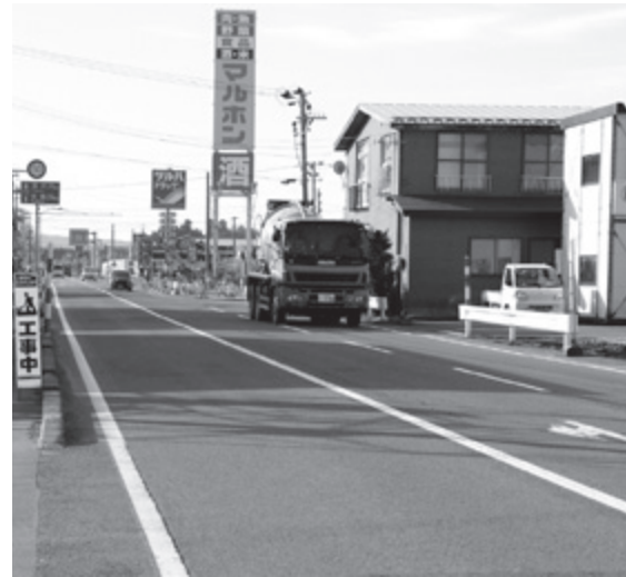
国道108号で歩道設置が進む薬師堂工区