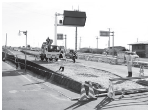
整備の進む、国道107号「本荘道路」