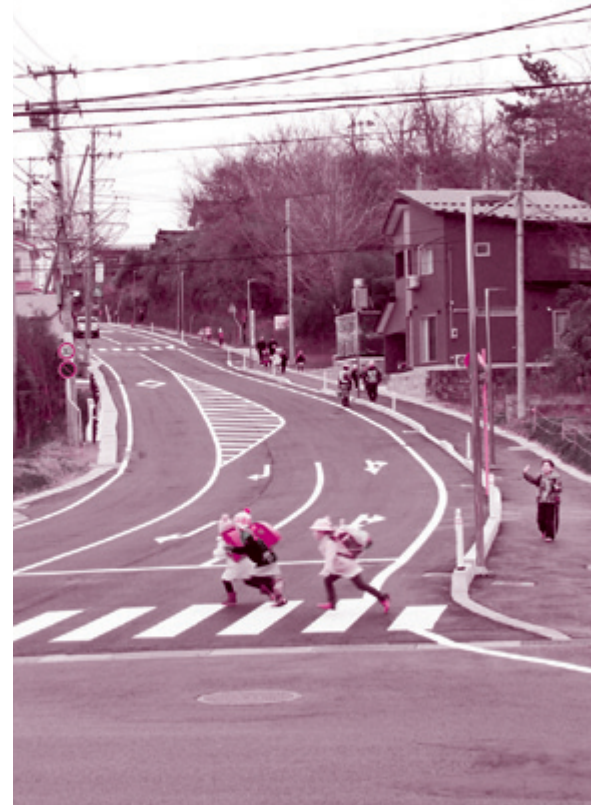
通学路の安全を確保。市道「鶴沼薬師堂線」