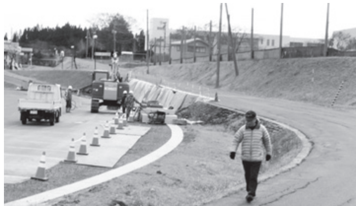
東由利「中学校線」に歩道を設置