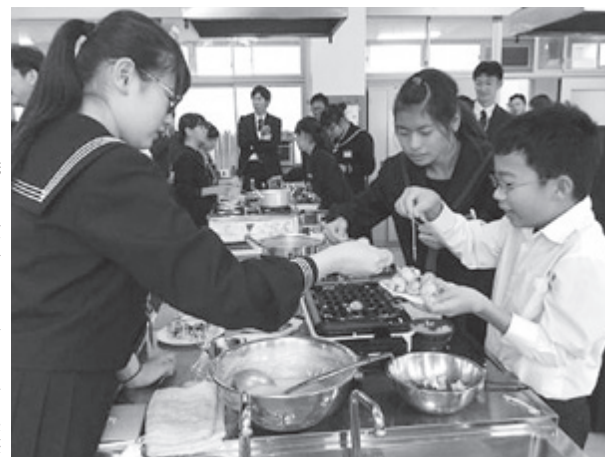
たこ焼きを食べながら、和やかに交流