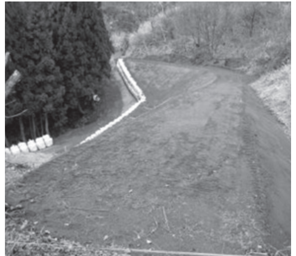
市道「吉沢東由利原線」は復旧延長177mを施工中

このほか、内陸部の同報系防災行政無線の改修や下水道の浄化センター長寿命化工事など、安全・安心な住みよいまちづくりを着々と推進しています。