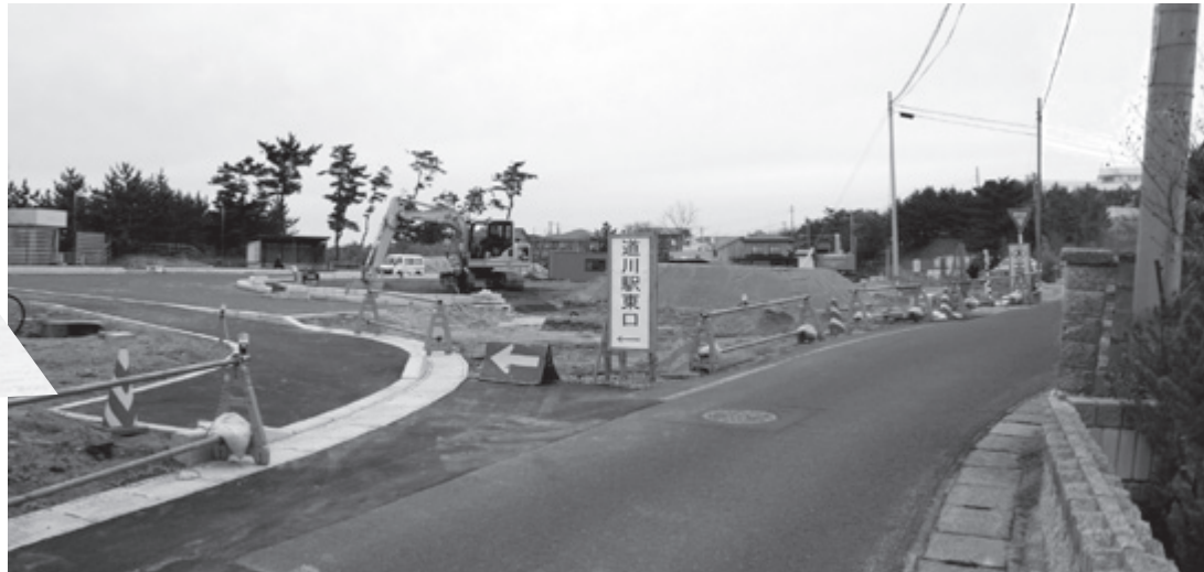
駅東口に通じる「道川駅線」改良工事