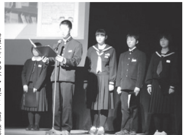
世界子どもの本アカデミー賞で発表

取り組みなどに学びながら交流を促進し、子どもたちにも見聞を広めさせたい」と意欲を述べました。今後、①学校教育、②学校・家庭・地域の連携などの活動研究を進めます。