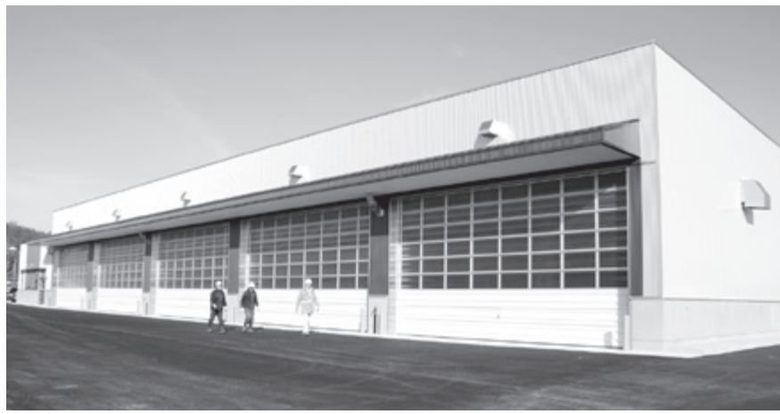
新たに建設された除雪ステーション