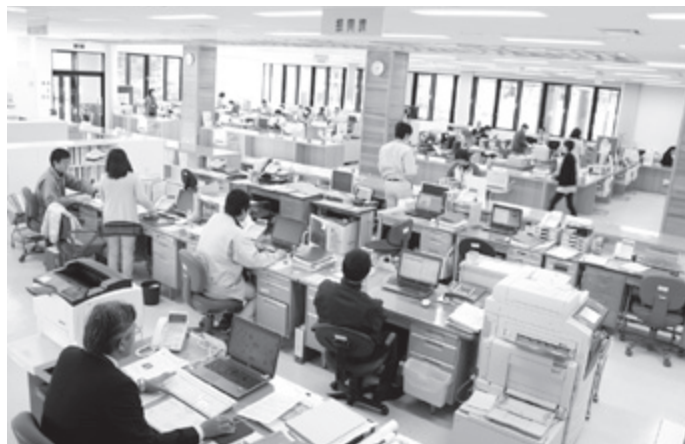
ワンフロアで各課の手続きができる矢島総合支所内部