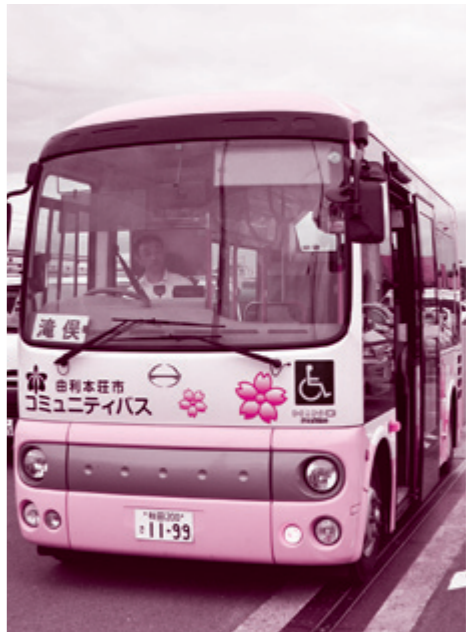
各地域を走るコミュニティバスは、利用者数や利用形態によりさまざまな車両で運行をしています。