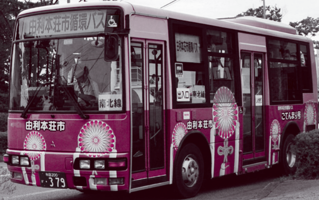
本荘地域循環バス南北線。10月1日から東西線と統合し、さらに便利になります。