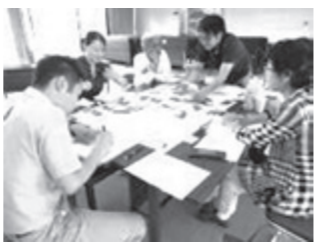
昨年、4回にわたり開催された「利用者促進のためのワークショップ」

「こてんまり号」に加え、新たな車両も仲間入り沿線の小学生が描いたイラストをラッピングした車両も運行します。「こてんまり号」とともに親しみのある車両が中心市街地を走りますので、ぜひご利用ください。