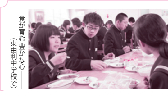
食が育む豊かな心 (東由利中学校で)

この計画の基本理念は「地域で支え、次世代を育む」子育ての喜びあふれる社会づくりです。子どもの育ちと保護者の子育てを行政や地域をはじめ、社会全体で支援し、子育ての楽しさや喜びを実感できるまちづくりを進めます。 この計画の基本理念は「地域で支え、次世代を育む」子育ての喜びあふれる社会づくりです。子どもの育ちと保護者の子育てを行政や地域をはじめ、社会全体で支援し、子育ての楽しさや喜びを実感できるまちづくりを進めます。