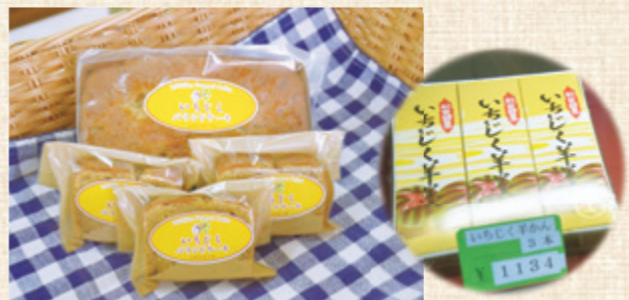
バウンドケーキはお客様の声で 切り売りをはじめました

特に「いちじく・オ・アマンド」は県内外で親しまれ、贈り物としても人気。アマンドはアーモンドのこと。アーモンドと組み合わせることでいちじくのおいしさが広がる。ごてんまりの形のもろこし「ごてんまりの里」や雪の茅舎大吟醸の「酒粕ケーキ」など、地元の特産品を生かしたお菓子も作っている。