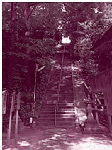
大物忌神社吹浦口之宮 （山形県遊佐町・吹浦）

鳥海山は、60万年もの長い間に、何千回も噴火してきました。噴火のたびに溶岩が流れ出し、それが積み重なってこの巨大な鳥海山ができました。この鳥海山ができたのが、遊佐町の十六羅漢は磨崖仏です。この仏様が刻まれているのが鳥海山の吹浦溶岩。十六羅漢のある岬は人間の舌のように海に向かって出っ張っています。これが吹浦溶岩そのものです。10万年前、噴火で流れ出した溶岩がそのま ま岬になったのです。この溶岩を体感できる場所があります。遊佐町吹浦の大物忌神社吹浦口之宮に行ってみましょう。鳥居をくぐると目の前に見える石段の一番下は溶岩の底です。この石段の一番上の部分が、厚い溶岩の上になります。その厚さはおよそ40センチ、石段で159段になります。石段を昇るとすっかり疲れてしましますが、それが溶岩の厚みなのです。ちなみに吹浦溶岩は、日本の溶岩の中では中くらいの粘り気度、中くらいの厚さ。粘り気の弱いマグマでできた富士山の溶岩は石段で30段くらい。粘り気の強い長崎県雲仙普賢岳の溶岩の厚みは300段もあるのです！