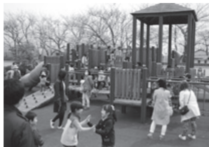
大型遊具で遊ぶ子どもたち(本荘公園で)