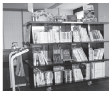
毎月100冊が並ぶ伝承館文庫（上川大内出張所）

上川大内と下川大内の各出張所、矢島福祉会館、道の駅清水の郷・鳥海郷に毎月50冊から100冊の入れ替え制の本棚を設置し、本の貸し出しをしています。