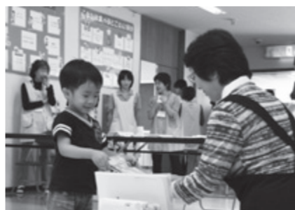
3歳児健診で（本荘保健センター）