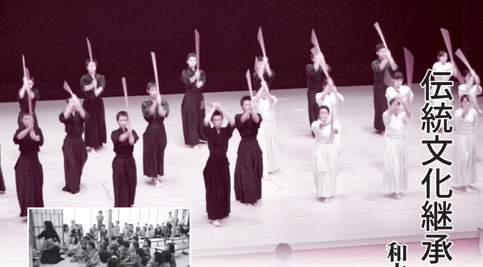
オープニングアトラクション (矢島中の全校剣道)