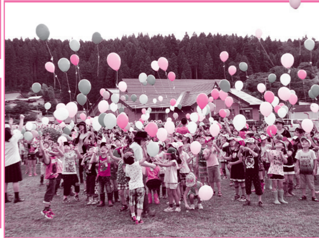
矢島ひまわりプロジェクトの風船あげ