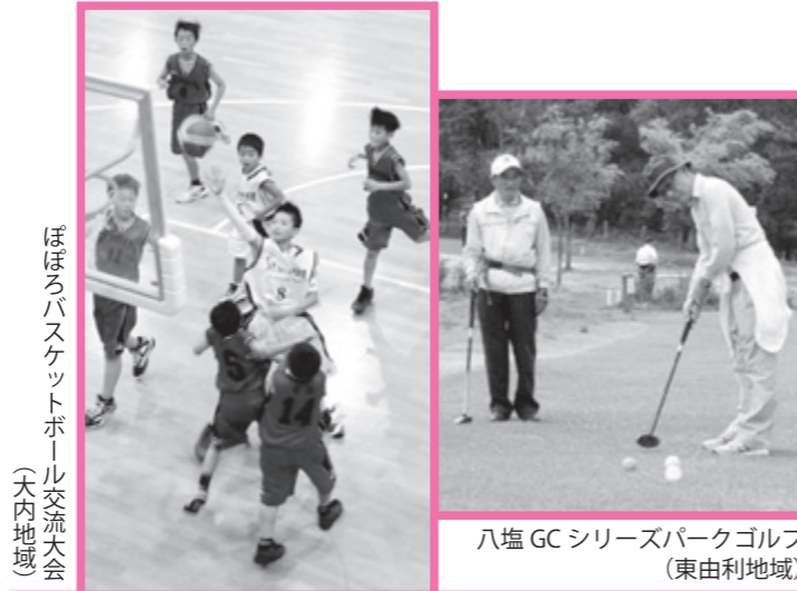
ぼぼろバスケットボール交流大会 (大内地域)