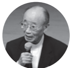
山折 哲雄 氏