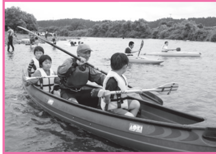
子吉川での水辺体験 (由利地域)