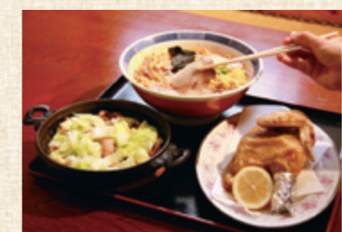
左から、ホルモン煮込み、ラージャン麺、鶏の唐揚げ

メニュー ホルモン定食やチャーシュー麺、ラージャン麺、鶏の唐揚げが人気。お客さんがよそで食べておいしかったと教えてくれたメニューをヒントに考案した。ホルモンの味付けはオリジナル。甘辛い味噌味で、市外から買いに来てくれる人もいいる。 メニュー ラージャン麺は「辣椒醬」という調味料が効いたピリ辛中華そば。好みに合わせて辛さの調節に対応している。 メニュー 中華麺は開店当初から岩谷町の高山製麺の麺を使用。