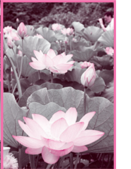
花蓮を見る会 (西目地域)