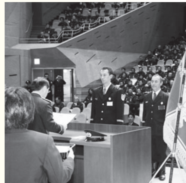
無火災支団を表彰