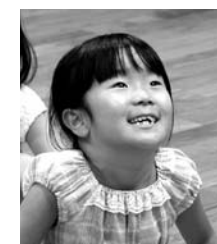
大人も子どもも一緒に体を動かしました(8月5日、カダーレ)