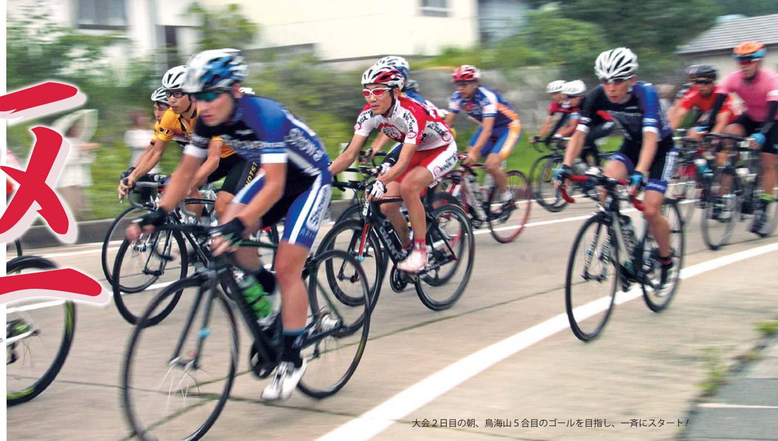
大会2日目の朝、鳥海山5合目のゴールを目指し、一斉にスタート！