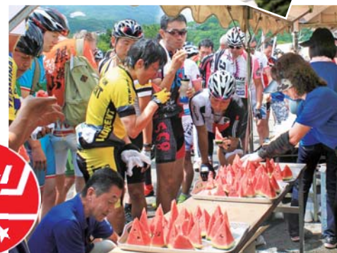
ゴール後に渡されるスイカも大会の大きな魅力