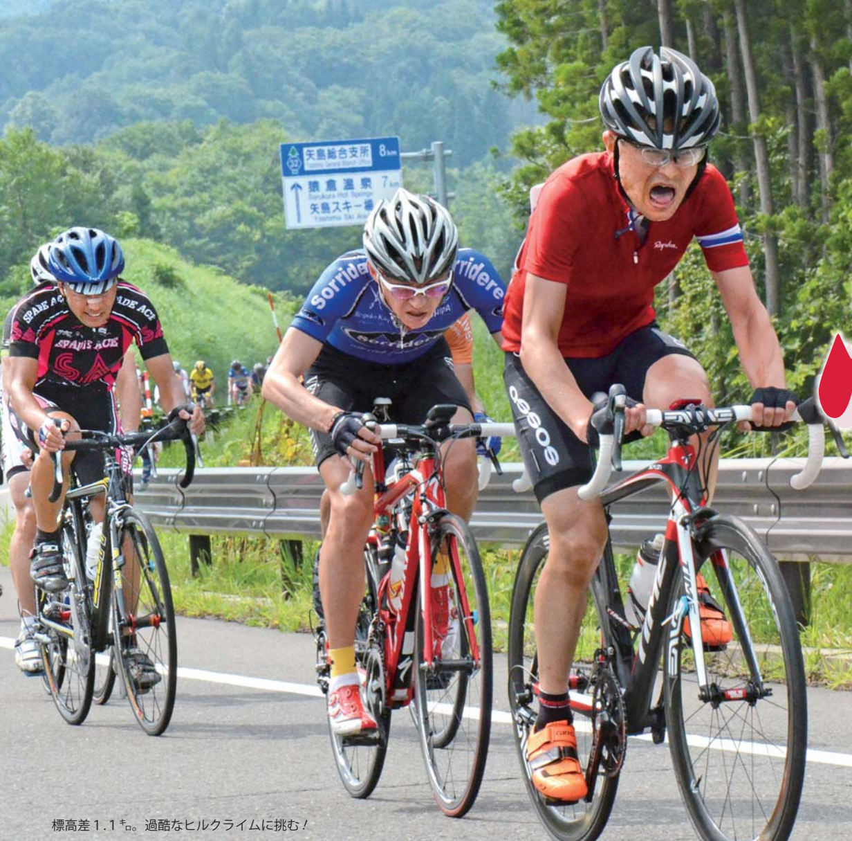
標高差 1.1 ㌦。過酷なヒルクライムに挑む！