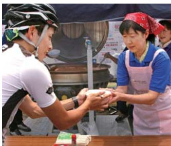
「この豚汁も楽しみます」