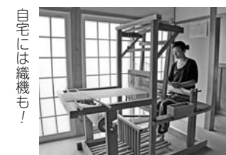
手作業で紡いだ糸 自宅には織機も！

「平嶋に新しい風を運んできてくれた」という言葉に、「こんなに喜んでもらえるとは」と驚いているそうです。 二人は雄さんの工房のオープン時にイベントを開き、近所の皆さんと料理や音楽、踊りを一緒に楽しんだり、今年7月に行った結婚披露パーティーにも町内の人を招待しました。「僕が趣味でアフリカの太鼓を叩くと、町内の人たちが自分の家から太鼓を出してきて一緒に叩いてくれたり、おばあちゃんたちも踊り出してくれたり。そういう交流がうれしいですね」と雄