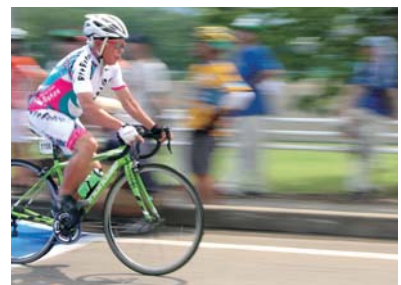
力強くスタートダッシュ！