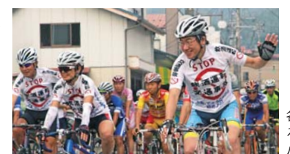
各チームがおそろいのウェアでパレード！