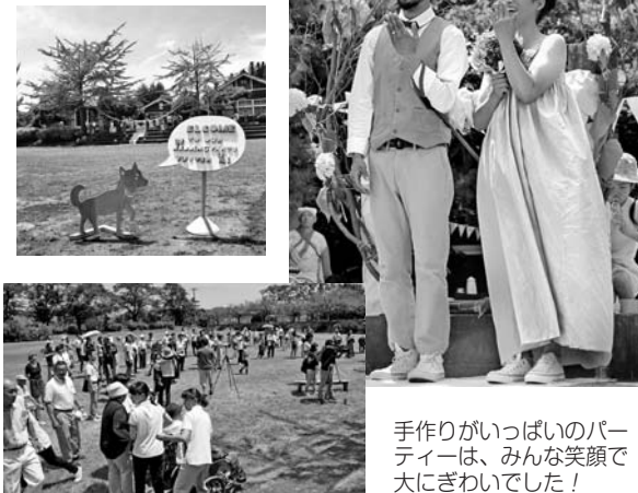
手作りがいっぱいのパーティーは、みんな笑顔で大にぎわいでした！