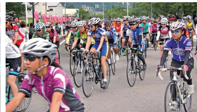
平成28年9月1日号 広報ゆりほんじょう 12