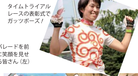
タイムトライアルレースの表彰式でガッツポーズ！