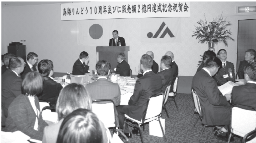
鳥海りんどう10周年と販売額2億円達成を喜び合った祝賀会

皆様には、穏やかな新年をお迎えのこととお喜び申し上げます。年の初めに、目標や抱負を掲げ、「気持ちを切り替えて頑張ろう!」とお思いの方もいらっしゃるのではないでしょうか。それぞれの分野で躍進や飛躍を誓う皆さんが新しいスタートを切っています。