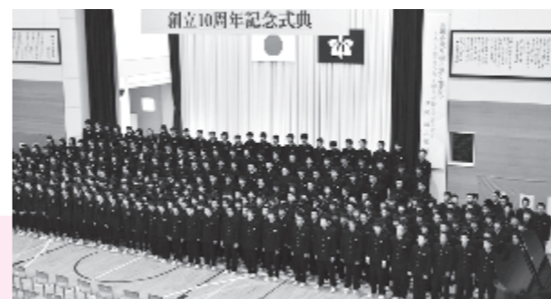
全校で校歌を斉唱