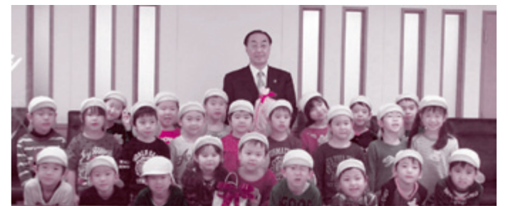
「勤労感謝の日訪問」で風の子保育園の年長さんと一緒に(11月19日)