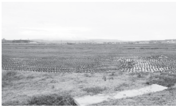
基盤整備された柴野地区の水田