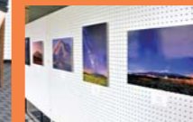
写真展の会場。思わず見入ってしまうような美しい作品ばかり!

★詳しくは、Facebookグループ「鳥海山麓の美しい景色を愛する会」のFacebookページをご覧ください。