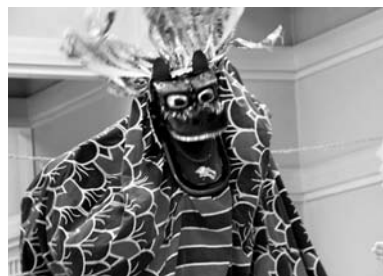
力強く舞う獅子 (3月23日・まい一れ竣工記念公演で)

◆ 春が来ました。今年の冬はいつもより雪が少なく、春をさせてもらいましたが、3月は気温が上がり雪が溶け、春の小川を感じることもなく4月を迎えました。新年度、雪消えと共に新し