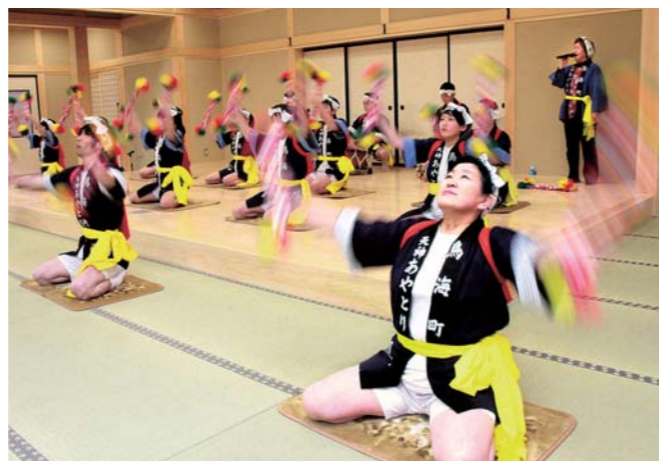
素早い手さばきであや棒を操る「天神あやとり」