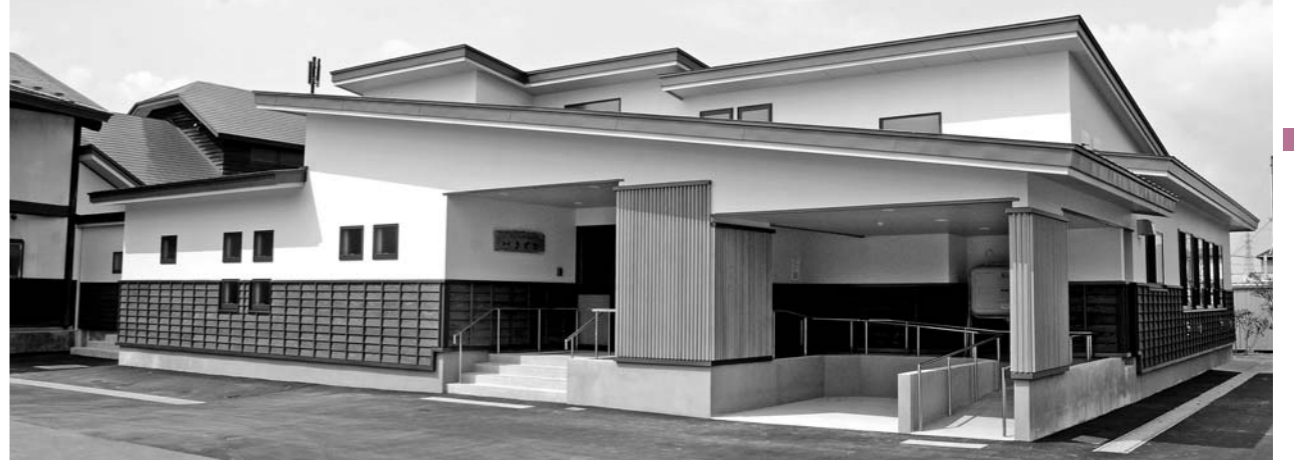
完成したウッドレイホールこだま新館きずな