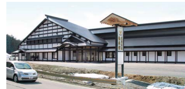
「まいーれ」の看板と外観