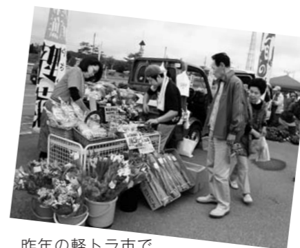
昨年の軽トラ市で

日時 5月21日(日)・7月30日(日) 10月1日(日) 各9時～13時半 会場 道の駅「東由利」黄桜の里 募集台数・区画数 軽トララック または仮設テント 計35区画 出店料 1区画あたり千円 申し込み 4月20日(木)まで、黄桜の里ひがしゆり活性化委員会(東由利ショッピングプラザ「ぶれっそ」内) ☎69-3266