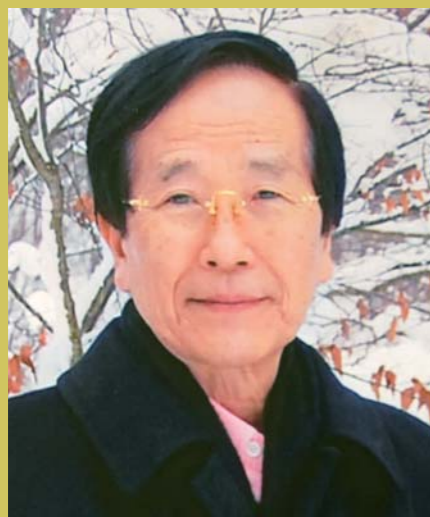
本市名誉市民・文化功労者