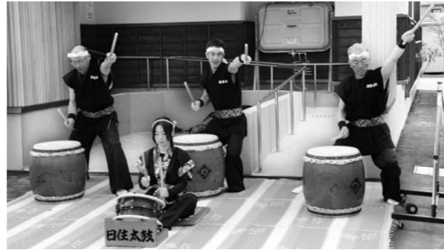
完成を祝う日住太鼓

昨年9月から建設工事が進められてきた石沢地区多目的集会施設「ウッドレイホールこだま新館きずな」が完成し、3月23日に竣工式が行われました。