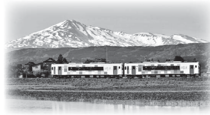
残雪の鳥海山とおぼこ号

時に添い歴史つらぬき 里をうるおし人をむすんで 子吉川 海へと向かう水の道 その海はせめぎあう世界へひらく 先人の知恵に学んで今日を生きる ふるさとの四季おりおりに 花はほほえみ風は薫って 鳥海の 山きよらかに裾をひき 頂はめぐるめく宇宙につづく 子どもらとともに夢見て明日を創る