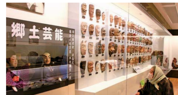
番楽面や貴重な道具類などが並ぶ資料展示室