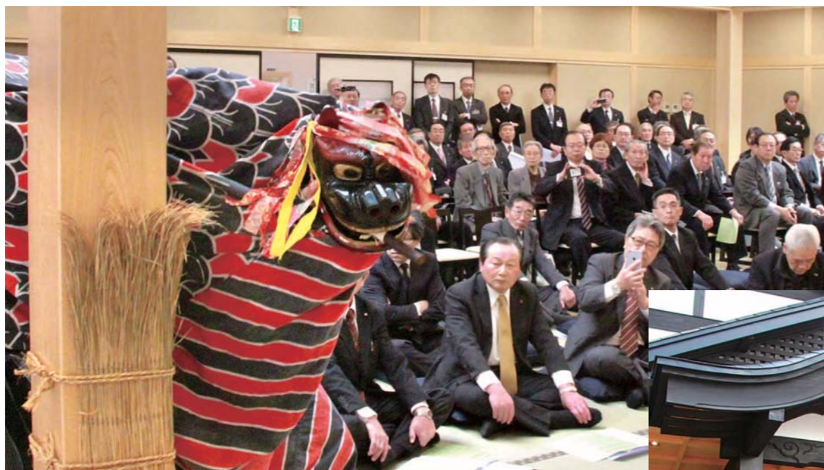
新居の火伏せを祈願する演目「柱がらみ」を披露