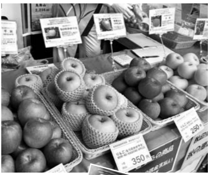
山菜やリンゴなど季節ごとに旬のものが並びます

問い合わせ先 まるごと売り込み課 ☎24-6266 メールアドレス urikomi@city.yurihonjo.lg.jp