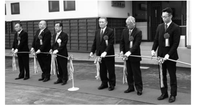
関係者によるテープカット