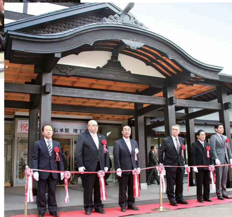
完成を祝い、玄関前でテープカット

5月3日の開館記念特別公演に続き、6月以降は毎月第3日曜に定期公演を開催。市内に伝わる多彩な民俗芸能の魅力に触れることができ、観光情報の発信やにぎわいづくりを担う拠点として注目を集めています。