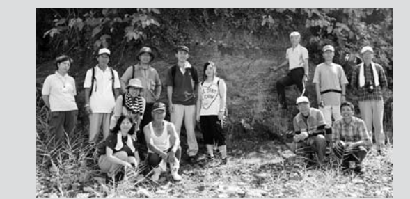
飛島(八幡崎)の津波堆積物の現地見学会。住民、公益大生と共に

島民の皆さんと現地見学会を実施することで、過去の津波の痕跡を目で、肌で感じる機会となりました。飛島の津波堆積物は飛島の大地のなりたちを知る遺産です。今後は、住民防災、観光防災の意識を高め、防災教育においても、住民参加のジオパーク推進のためにも貴重なジオサイトになっていくことでしょう。