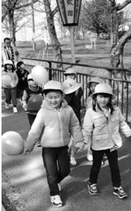
歩き初めする児童たち (桜・菜の花まつり)

「桜・菜の花まつり」のオープニングセレモニーが4月13日、西目地域のハーブ通りで行われました。関係者はテープカットを行い、西目小の1年生18人と共に桜並木を歩き初めして開幕を祝いました。