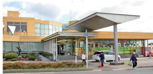
温泉施設やレストランのほか、「出羽伝承館」遊具のある広場が隣接する道の駅おうち