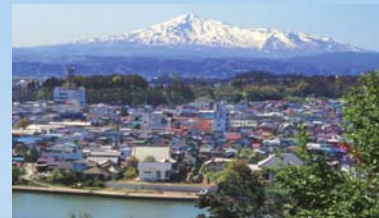
新山公園から望む鳥海山と子吉川、本荘地域の街並み

春の大型連休がスタートしました。うらかな気分誘われ、期間中、旅行やレジャーを計画している方もいらっしゃるでしょう。