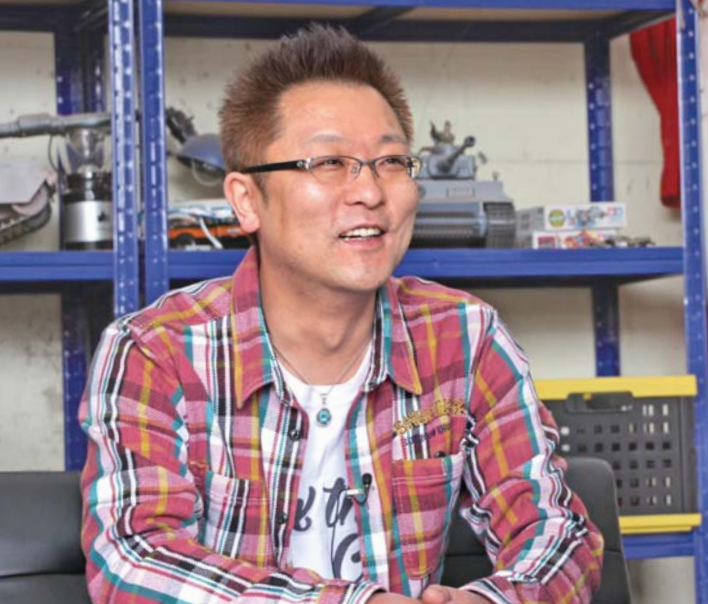
「欲しいものがあったら要望にはできるだけ応えていきたい」と話す工藤さん