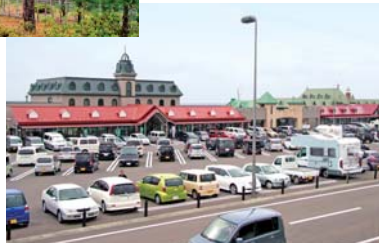
「港の湯」や産直施設などがあって、島式漁港公園の隣接する道の駅岩城