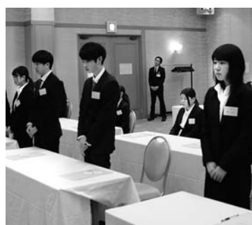
一人ずつ紹介される新入社員たち