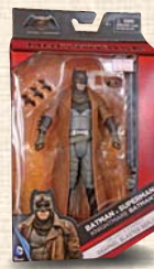
ナンバープレートモチーフにした植木鉢が人気

話題のキャラクターも：テイストの若い人向けの店が多いと感じたので、大人が楽しめる「秘密基地」のような店を目指して始めた。