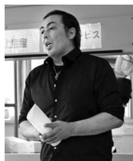
岡料理長が新メニューを説明

また、4月14日には本荘公園で本荘さくらまつりのオープニングセレモニーが開催され、市観光協会の村岡淑郎会長、長谷部市長ら関係者7人がのろしの合図とともにテープカットを行いました。この後、公園前広場では本荘追分保存会が民謡を披露し、オープニングを盛り上げました。 4月から始まっている「由利本荘春の花巡り」は、つつじまつり・黄桜まつり・菜の花まつりと引き続き開催していますので、ぜひご友人やご家族と春の花をお楽しみください。