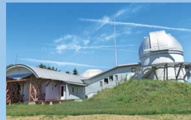
スターハウス「コスモワールド」(プラネタリウム)が連休中の5月3~7日に開館します。お楽しみに。