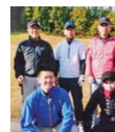
ゴルフで楽しく交流!

「知り合いの全くない由利本荘に来て、人とのつながりで助けていただき、力を貸してもらっていることを日々実感します。とてもありがたく思っています」と話し、目を細めました。