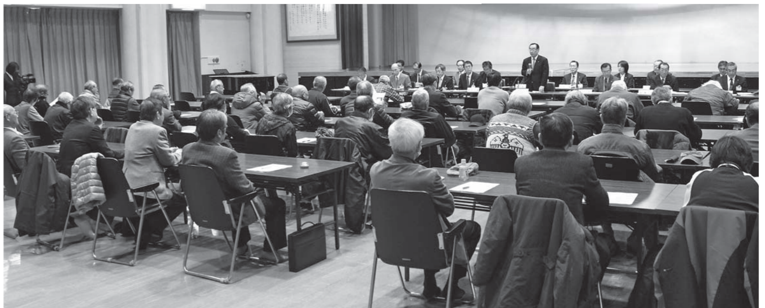
岩城地域の「ふれあいトーク」で

Q 昨年、紅葉の時期に法体の滝に行った。周辺道路の案内をもっと充実させてほしい。