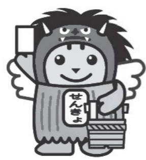
明るい選挙イメージキャラクター なまはげめいすいくん