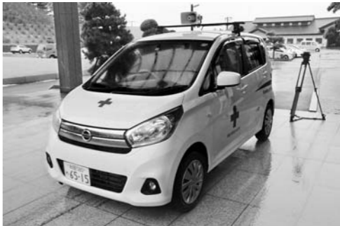
岩城地域に配備される災害救援車

のほど、災害救援車両1台とAED（自動体外式除動器）4台、ワンタッチテント1張りを寄贈していただきました。 これは、地域に密着した赤十字活動の推進と周知、地域福祉の増進に活用する赤十字災害救護資器材配置事業の一環によるものです。 市では、災害救援車両を岩城地域に、AEDを東由利・西目・大内・由利地域に、ワンタッチテントを矢島地域に配備する予定です。