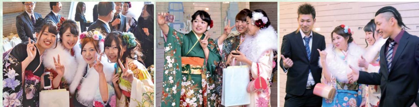
みんな笑顔で記念撮影！