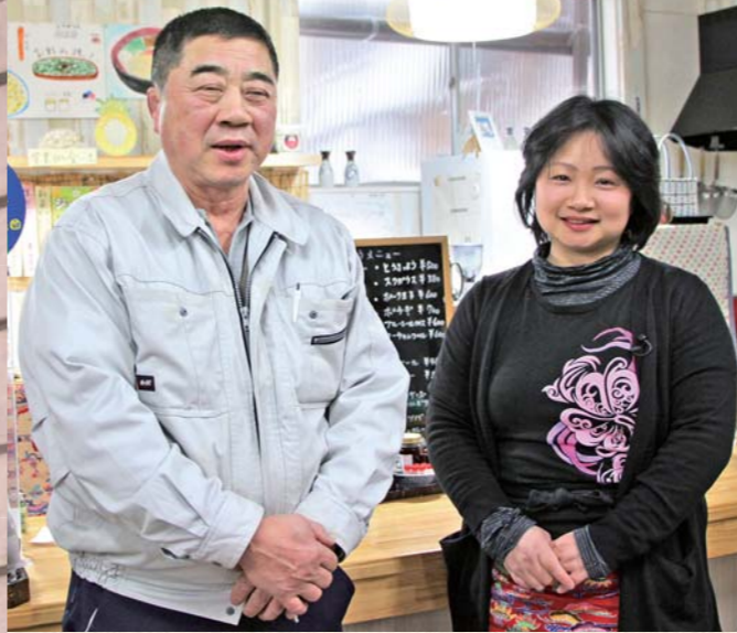
自然体で迎えてくれる重さんとあゆ美さん