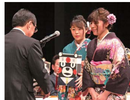
新成人からの募金