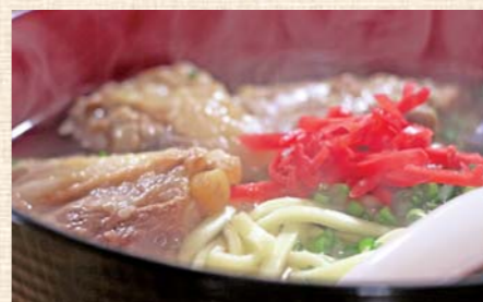
ソーキそば。もちもちの麺とボリュームのある豚肉で、あっさり味でも満足感のある一杯

おすすめ カフェの看板メニューは「ソーキそば」。麺は沖縄から取り寄せ、その他の食材は地元産のものを使うようにしている。豚肉は1日半かけて煮込み、ジュシーで軟骨も全て食べられる柔らかさ。スープは秋田県民の口に合うよう、本場のものより少しだけ濃いめにアレンジしている。 そばの味にアクセントを加える「こーれーぐーす」は他にない一品。泡盛の代わりに地元の日本酒「雪の茅舎」を使って唐辛子を漬け込んだもので、西目のリンドな辛さで癖になる人も多い。他にも沖縄の料理やスイーツのメニューが豊富。