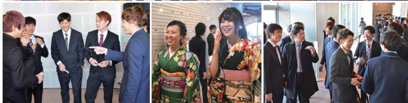
友人との再会を喜ぶ新成人たち！