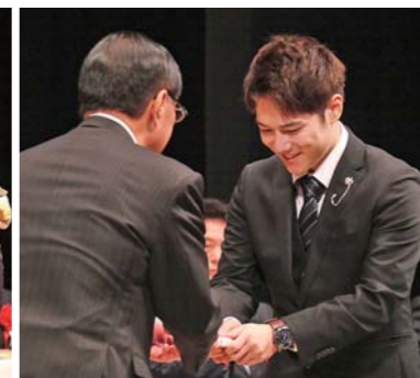
新成人へ記念品を贈呈