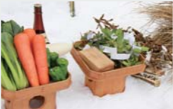
供物やタラの木のゴンギョウ