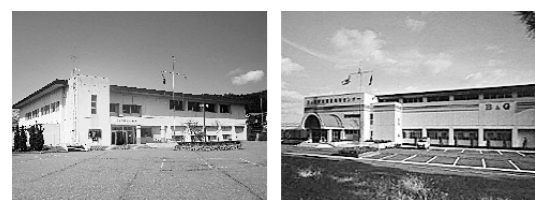
特A評価を受けた由利（左）と西目（右）のB&G施設

第9回B&G全国サミットが、東京都港区の笹川記念館で開催されました。このサミットを主催する公益財団法人ブルーシー・アンド・グリーンランド財団では、青い海（ブルーシー）と緑の大地（グリーンランド）を活動の場として、海洋性レクリエーションをはじめとする自然体験活動などを通じて、次代を担う青少年の健全育成と幼児から高齢者までの「心とからだの健康づくり」を推進しています。サミットでは、特別基調講演や事例発表のほか、全国472