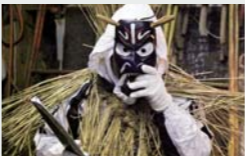
ケラミノをまとって