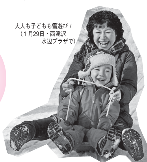
大人も子どもも雪遊び! (1月29日・西滝沢 水辺プラザで)