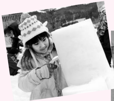
県立大学前で行われたホップ・ステップ・キャンパス。雪の中のろうそくの明かりで幻想的な空間になりました。