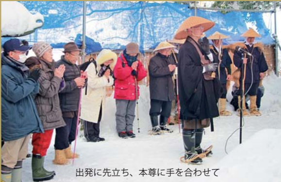
出発に先立ち、本尊に手を合わせて