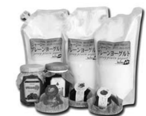
※送付される商品の一例

岩城地域「天鷲ワイン」と矢島地域「花立牧場工房ミルジー」の商品が2～4月の間、毎月お手元に届きます。香り高いブラム、濃厚なジャージー牛の乳製品をぜひご賞味ください。 料金 3000円/月（2～4月で計9000円・税込み） 申し込み・問い合わせ先 2月20日(月)まで、(株)岩城 天鷲ワイン事業課 ☎74-2100、花立牧場工房ミルジー ☎55-2929