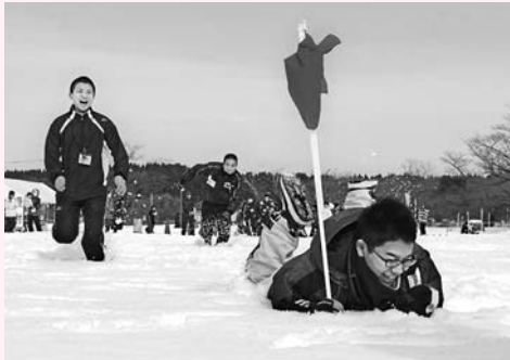
西滝沢水辺プラザでは、雪上運動会が大盛り上がり。