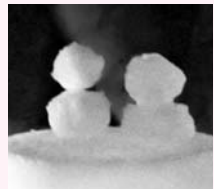
寒さを吹き飛ばすような、にぎやかな声が響きました。