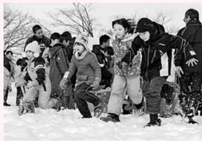
スノーシューをはいて、よーいドン!