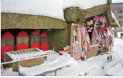
雪に覆われた六地藏堂