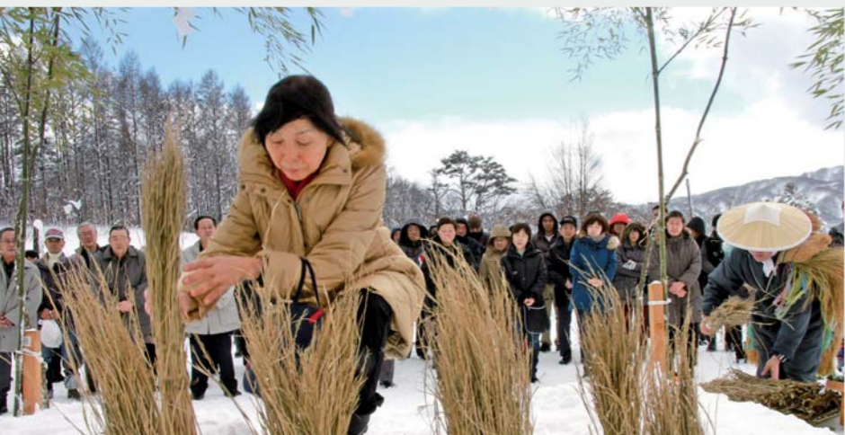
わらの束を稲に見立て、丁寧に

伝統がすたれないよう、先代からの習わしを引き継ぎ、絶やさない気持ちで努めています。地域や家庭で行われた行事も昔の形ではなくてもいいので、続けてほしいと願っています。