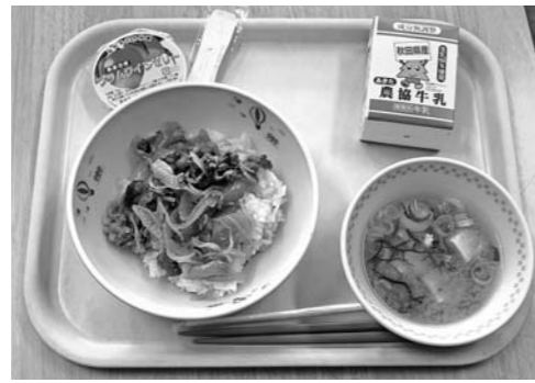
笑顔で給食を味わう児童（上）と秋田由利牛の給食

地元産の秋田由利牛を使った給食が、1月23日から27日にかけて市内の各小学校で登場しました。