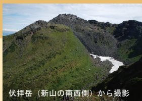
伏拝岳（新山の南西側）から撮影