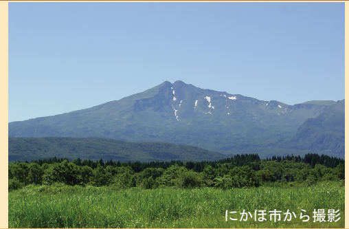
にかほ市から撮影