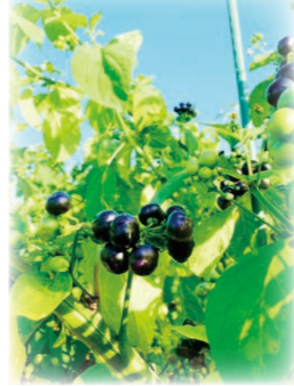
ガーデンハックルベリー ナス科の植物。ポリフェノールの一種であるアントシアニンが豊富。